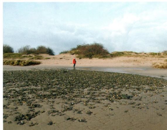
Afbeelding 6. De duinen van De Bol bij laag water vanaf de rivier gezien.

In de huidige situatie (Afb. 1 en 2) is duidelijk te zien dat tussen de noordpunt van het voormalige eiland en de winterdijk landaanwas heeft plaatsgevonden. Er is een