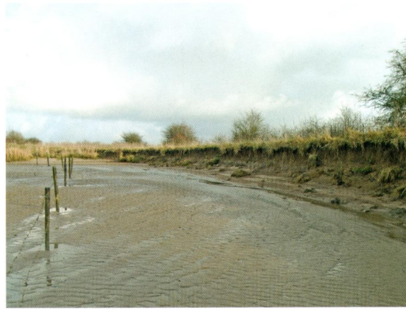
Afbeelding 5. Plaatselijke afkalving van het eiland De Bol door de Binnenlek. Het hek dient om bezoekers van de wand af te houden in verband met nestelende oeverwaluwen.

aanzienlijk aan kracht gewonnen door de langzame verzanding en uiteindelijke afdamming van de Kromme Rijn bij Wijk bij Duurstede in 1122. Misschien was de verhouding tussen de sedimentlast (grind, zand en klei) en de waterafvoer in de 18e en 19e eeuw dusdanig dat er talrijke zandbanken in de rivier de Lek ontstonden, maar mogelijk speelden ook andere factoren een rol. Op oude rivierkaarten, zoals b.v. de 'Kaarte van de Lek, met de dijken, uitterweerden, zanden, hoofden, enz. strekkende van boven de vaart tot beneden Schoonhoven' (D. Hooft, 1738), zien we namelijk een scala aan zandbanken in de Lek. Ook in 1837 kunnen we op kaarten van Goudriaan (Afb. 8) nog diverse zandbanken in de rivier zien liggen. Het eiland De Bol heette overigens in 1738 nog de Slaapwerf. Deze naam hangt mogelijk samen met de zalmvisserij die hier toen beoefend werd.