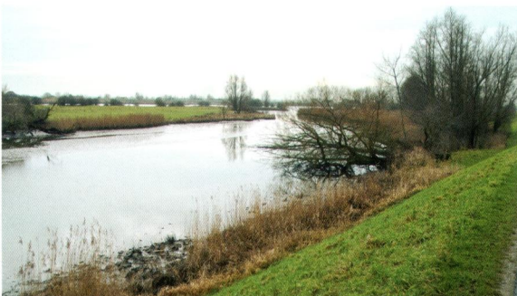
Afbeelding 4. De getidekreek de Binnenlek is prima te zien vanaf de winterdijk.

De mens heeft zo'n nadrukkelijke rol gespeeld bij het ontwikkelen van het eiland De Bol, dat het verstandiger is om de geogenetische en de historische achtergrond gelijktijdig te behandelen. Het eiland De Bol is gelegen in de Lek. De Lek is een relatief jonge rivier die pas na het begin van onze jaartelling is ontstaan. De rivier heeft