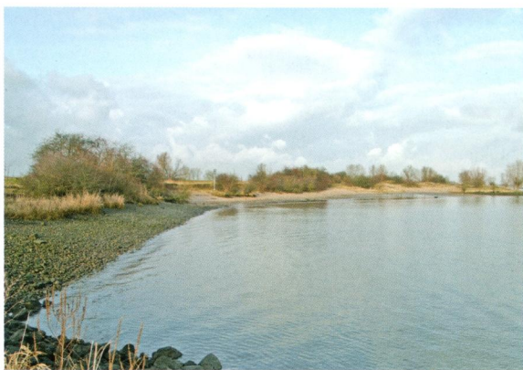
Afbeelding 7. Stroomafwaarts van de rivierduinen is het natuurlijke karakter van het eiland ernstig aangetast door verstening die in het verleden ter oeververdediging is aangebracht.