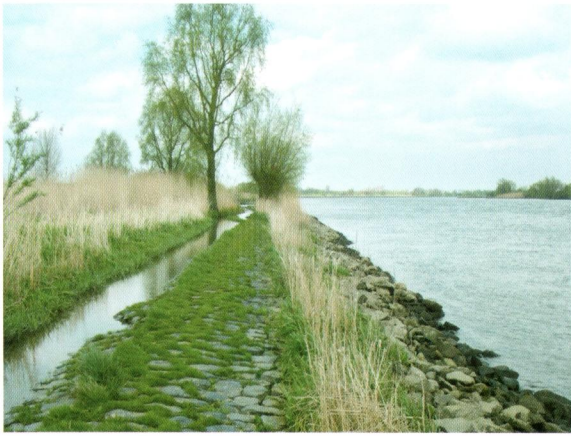
Afbeelding 3. De strekdam waarmee het eiland De Bol aan de winterdijk is verbonden. Links rietgorzen.