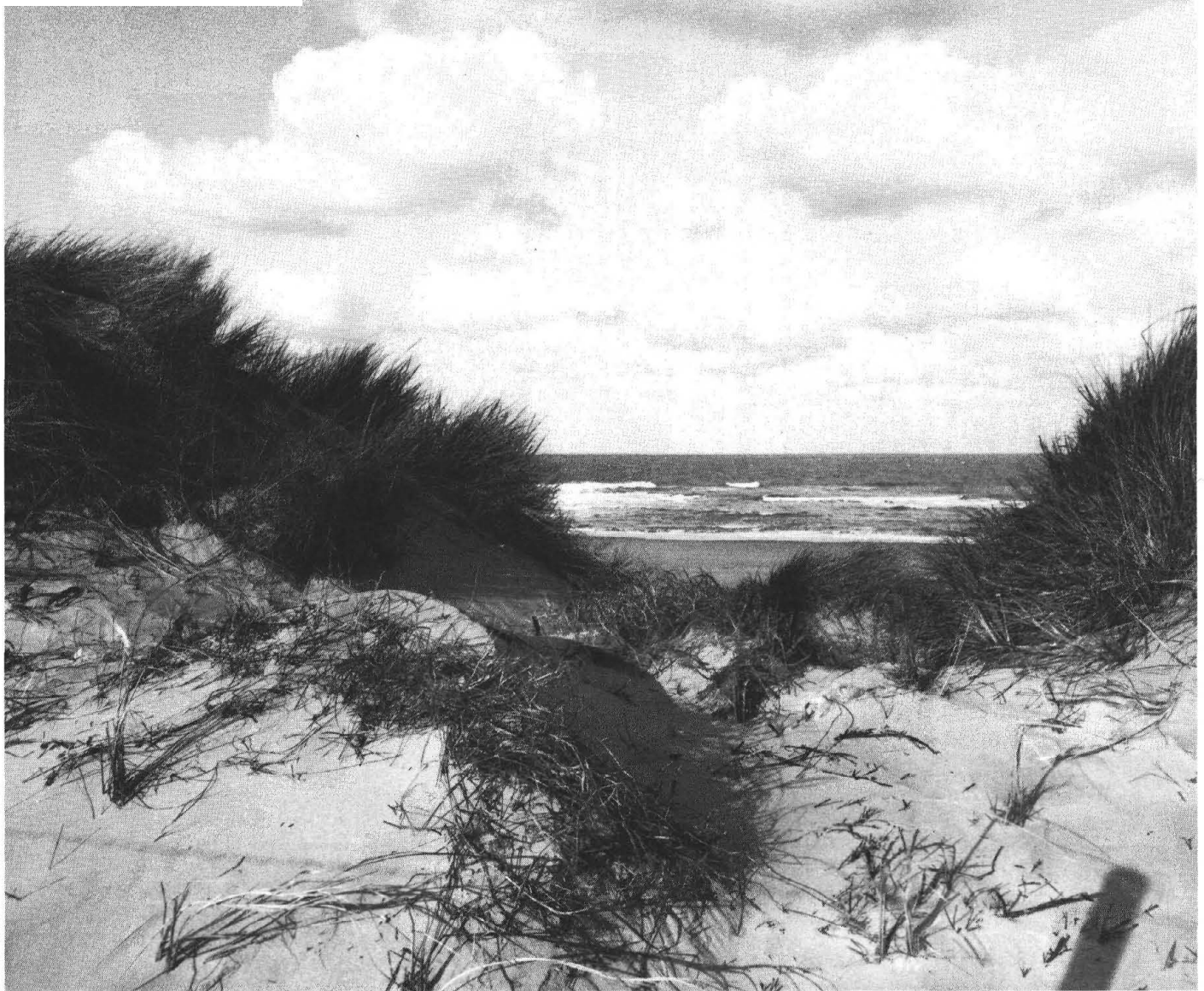
Dynamiek in de kustzône Dynamic in the outer dunes.