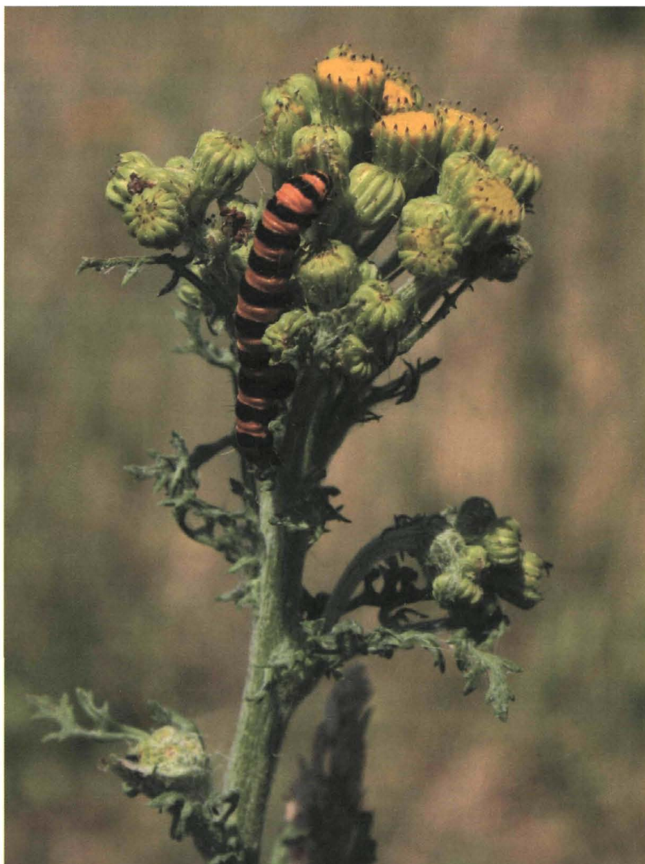
Foto 2. Ook op de Veluwe komen de rupsen van de Sint-jakobsvlinder ( Tyria jacobaea ) voor, die de gifstoffen van Jakobskruid weerstaan en zelfs inzetten om zelf giftig te worden voor hun vijanden. Toch zijn niet zij maar de bodemorganismen verantwoordelijk voor het temmen van hun giftige gastheer.