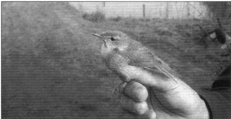
Struikrietzanger, 1* kalenderjaar, 23 Oktober 2009, VRS AW-duinen