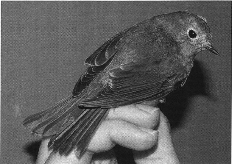
Blauwstaart: 1e kalenderjaar.

Na het maken van de nodige bewijsplaatjes en toen Arnoud van den Berg en Peter Nuyten ook enkele roepjes hadden kunnen opnemen, is de Blauwstaart, geringd en wel, weer losgelaten.