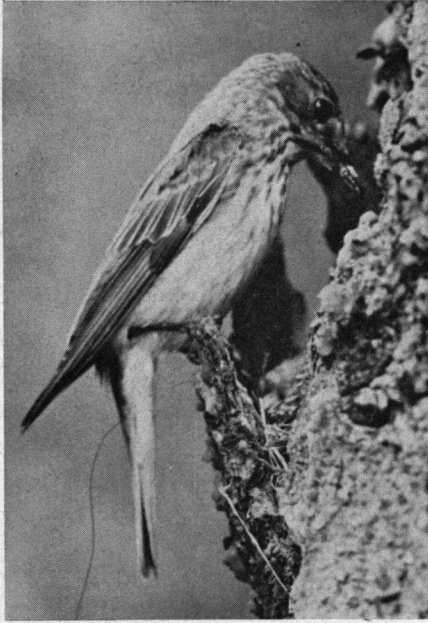
De kaarsrechte zit werd nog rechter . . .

werd onttrokken en het bovendien met zijn dikke honderd meter duidelijk buiten het normale vanggebied van de vliegenvangers lag.