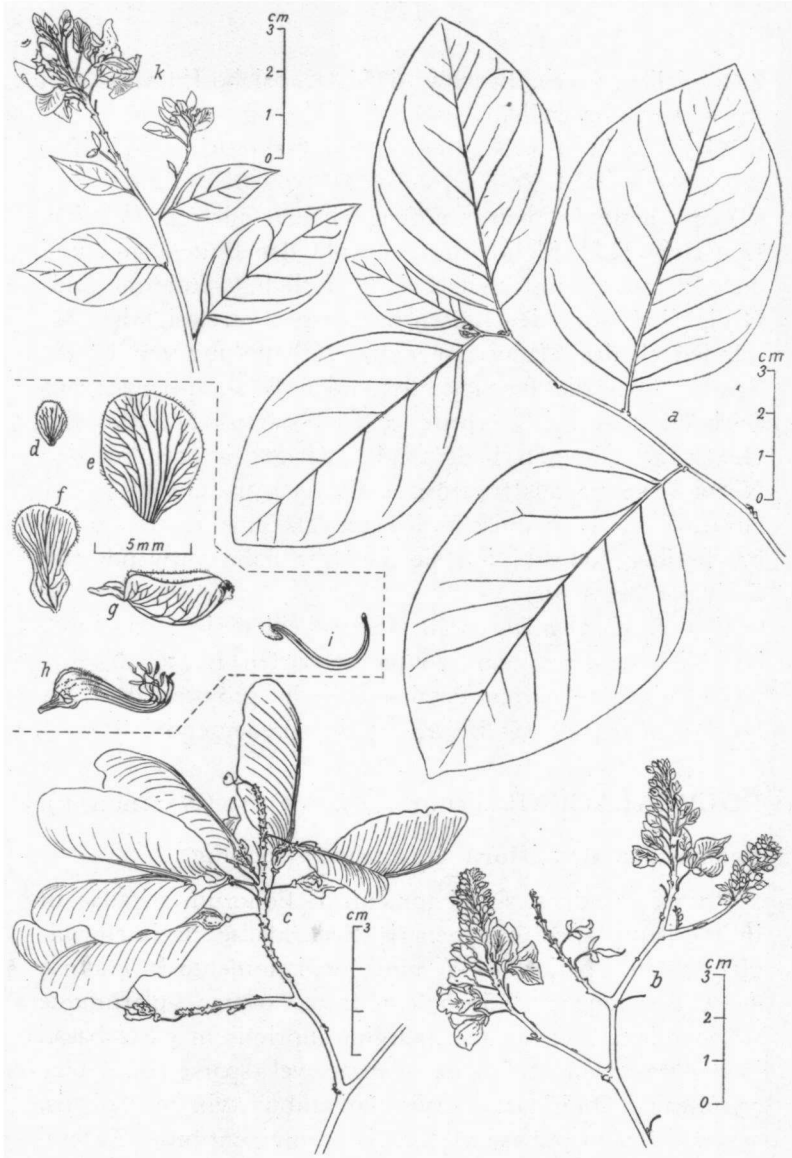
Fig. 2. Securidaca densiflora Oort, B.W. 637 a. Leaves, b. flowers, c. fruits, d. exterior sepal, e. ala, f. lateral petal, g. carina, h. stamens, i. pistil; k. flowers of B.W. 6699.