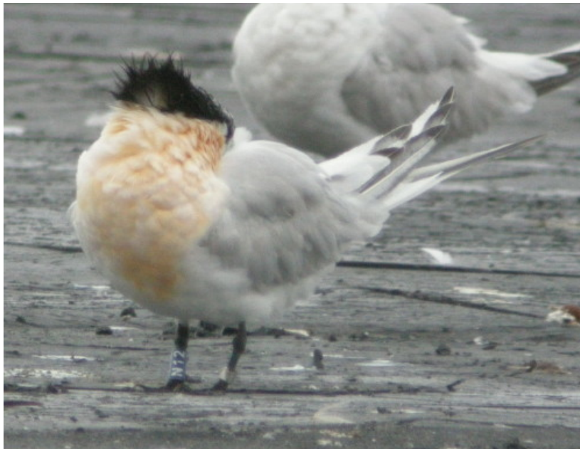
Figuur 6 Grote Stern N12 op 30-07-2010 in Musselburgh, Schotland Sandwich Tern N12 on 30-07-2010 in Musselburgh, Scotland.