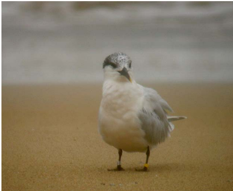
Figuur 5 Grote Stern op het strand van Saint Laurent-sur-Mer (Normandië, Frankrijk) op 20-11-2009. Sandwich Tern on the beach of Saint-Laurent-sur-Mer (Normandy, France) on 20-11-2009.