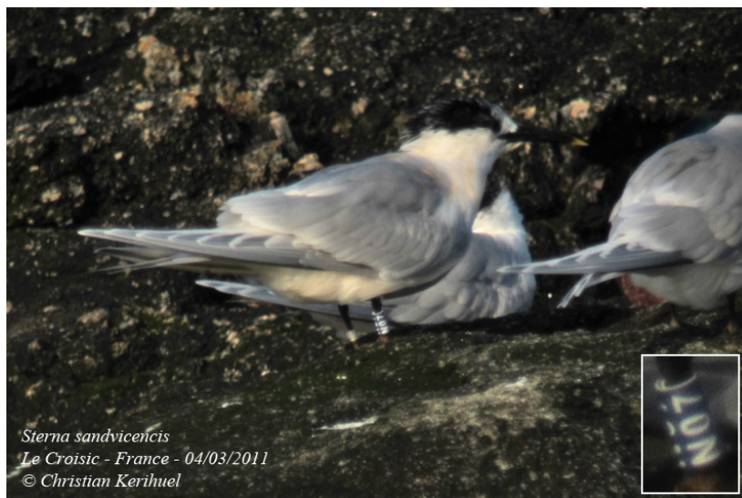
Figuur 8 Grote Stern N07 op 04-03-2011 in Le Croisic, Frankrijk Sandwich Tern N07 on 04-03-2011 in Le Croisic, France.