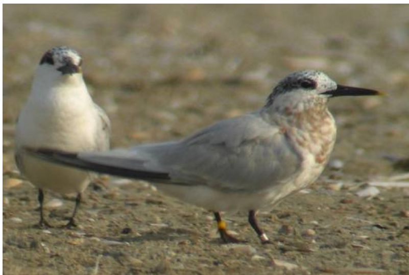
Figuur 3 Grote Stern 0-240 gezien op 07-08-2009 en 23-08-2009 op de het strand nabij de Pier van IJmuiden. Sandwich Tern 0-240 seen on 07-08-2009 and 23-08-2009 on the beach near the Pier van IJmuiden.

← Figuur 2 Cumulatieve kaart (periode 19 mei - 29 juni) met daarop de positiebepalingen van vogel 0-247 (vogel met mislukt broedsel, 19 mei gezenderd, begin juni broedsel verlaten), bepaald vanuit het vliegtuig. Inzet is een foto van de vogel, gemaakt vanuit het vliegtuig, zittend op een zandplaat op 15-06-2009 (Foto S. Lilipaly/Zeeland air). Cumulative map (period 19 May - 29 June) with locations of Sandwich Tern 0-247 (failed breeder, tagged on 19 May, left colony start of June) detected from an airplane. Set-in is a photograph taken from the survey plane of the bird sitting on a sandy plate on 15-06-2009 (Photograph S. Lilipaly/Zeeland air).