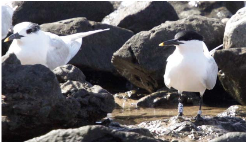
Figuur 7 Grote Stern N22 op 01-03-2011 op Lanzarote, Canarische Eilanden. Sandwich Tern N22 on 01-03-2011 at Lanzarote, Canary Islands.