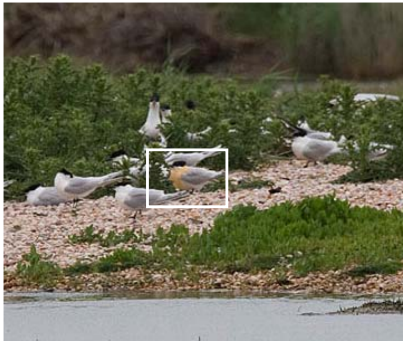
Figuur 4. Grote Stern 1-049 gezien van 24-05-2009 tot 27-25-2009 in de Petten (Texel). Sandwich Tern 1-049 seen from 24-05-2009 until 27-25-2009 in de Petten (Texel).