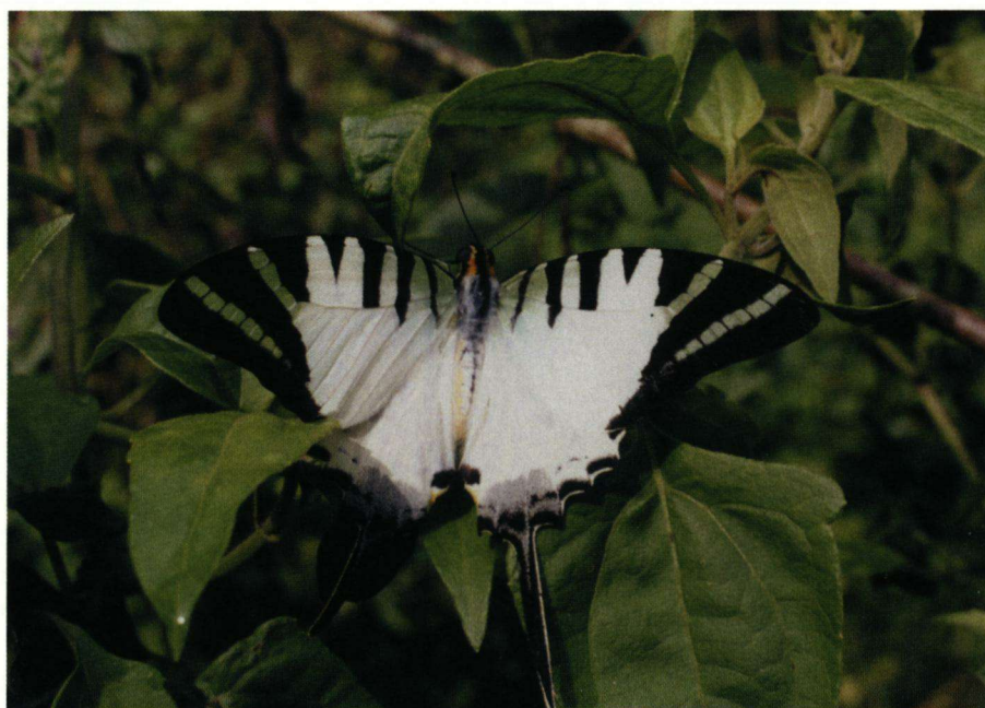
Graphium antiphates (Papilionidae).

Enige onderzoeksresultaten Tijdens het veldonderzoek zijn 404 vlindersoorten waargenomen, behorend tot zeven families. In het park werden 22 vlindersoorten en ondersoorten binnen drie families gevonden die niet eerder in Vietnam zijn waargenomen. Verder werden er 15 vlindersoorten, behorend tot vijf families, voor de eerste keer in het zuiden van Vietnam waargenomen. Van vier andere waargenomen nieuwe vlindersoorten voor het park lukte het niet om specimens te verkrijgen. Deze waarnemingen wachten op bevestiging. Een aantal soorten ondergaat speciaal onderzoek en er wordt nog gewerkt aan de identificatie van een paar honderd specimens.