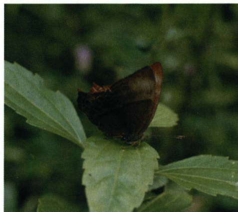
Abisara echerius (Riodinidae).

Sinds het onderzoek zijn er dus 440 soorten vlinders bekend in dit park. Duidelijk bleek dat het om een mix van soorten met verschillende biogeografische karakteristieken gaat. Dit valt deels te verklaren uit de lig-