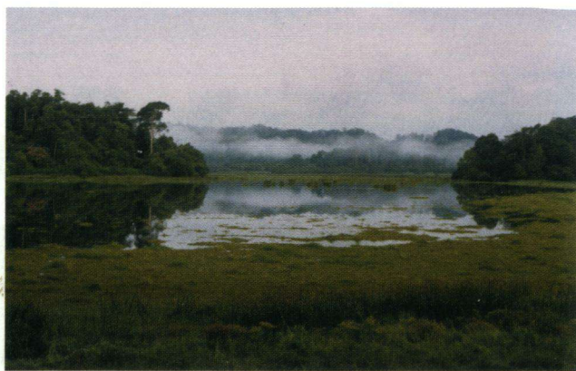
Nationaal Park Cat Tien.

Vlinderonderzoek In het jaar 2000 had vlinderonderzoek plaats met als hoofddoel een overzicht te krijgen van de vlinderfauna in dit park. Belangrijk daarbij was het opleiden van parkmedewerkers in vlinder-identificatie en veldonderzoek. Een technisch rapport werd vervaardigd waarin een vlindersoortenlijst, een korte beschrijving per verzamelde soort, een discussie over de geografische distributie en een beschrijving van de ecologische kenmerken van de vlindergemeenschap. Er wordt nog gewerkt aan de beschrijving van nieuw gevonden taxa.