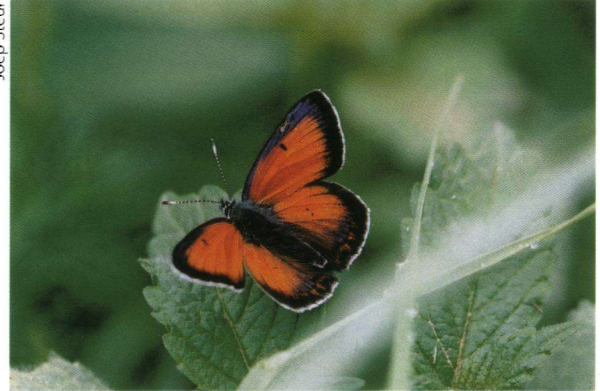
Balkanvuurvlinder (m) in de Rodópen.

Pomaken. Dorpjes met minaretten stralen een oriëntaalse sfeer uit. In the middle of nowhere ziet men vrouwen in traditionele pofbroeken het land bewerken. Piepkleine gehuchtjes zijn half vervallen. Deze streek is arm en toeristen zijn nog iets bijzonders!