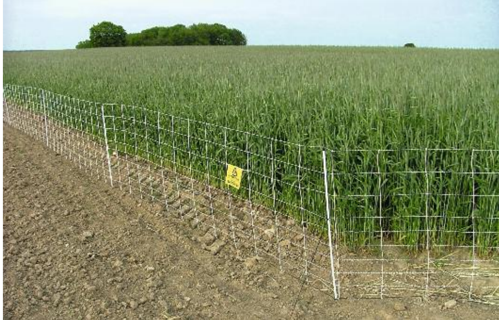
Een uitgerasterd perceel met elektrisch schapenraster.

Om meer inzicht te krijgen in de overleving van Hamsters in het veld zijn vanaf de start van het herintroductieproject