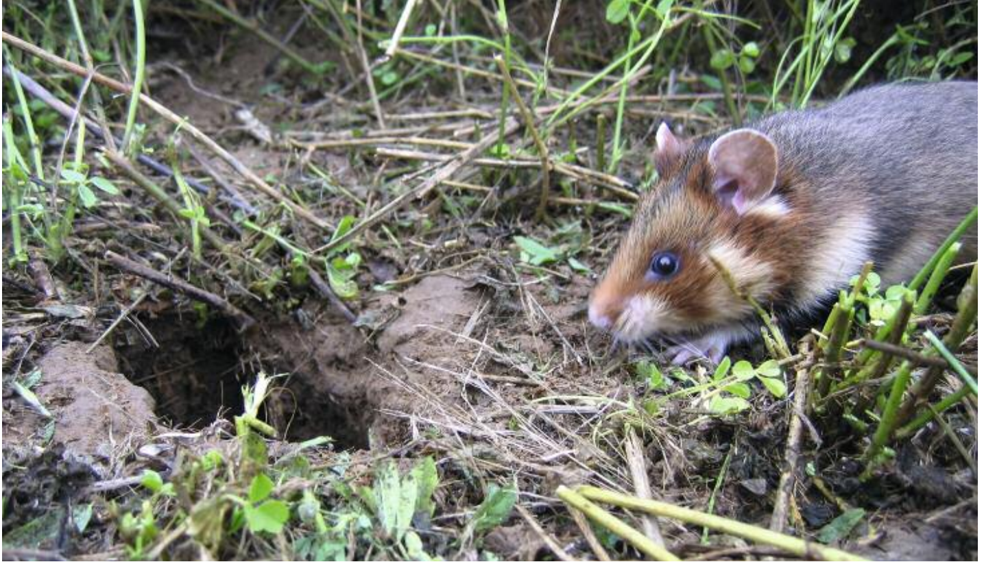
Hamster bij burcht.