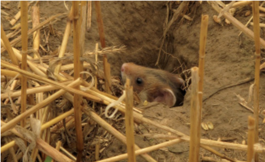
Wilde hamster.

Het gaat erbarmelijk slecht met onze wilde hamsters! Het is vijf na twaalf en de middelen worden niet naar behoren aangewend. Actieve hamsterburchten