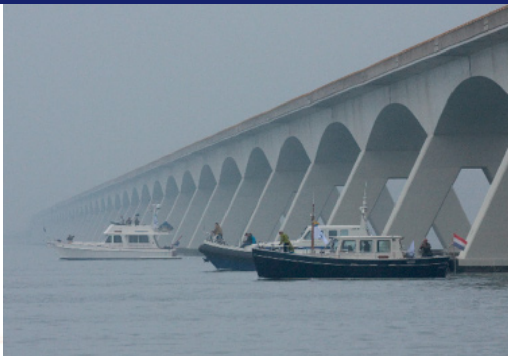
In linie onder de Zeelandbrug op zoek naar bruinvissen.