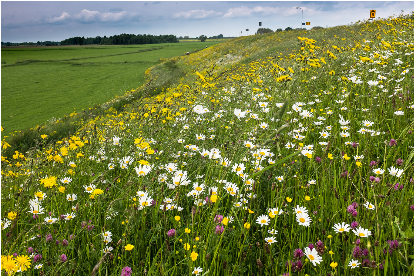
Fig. 1. De dijk bij Ochten met massavegetatie van Leucanthemum ircutianum . Foto: R. Haveman, 21 mei 2016.

hoewel de morfologische verschillen slechts gering zijn. Met enige oefening lijken de soorten echter wel degelijk goed van elkaar te onderscheiden.