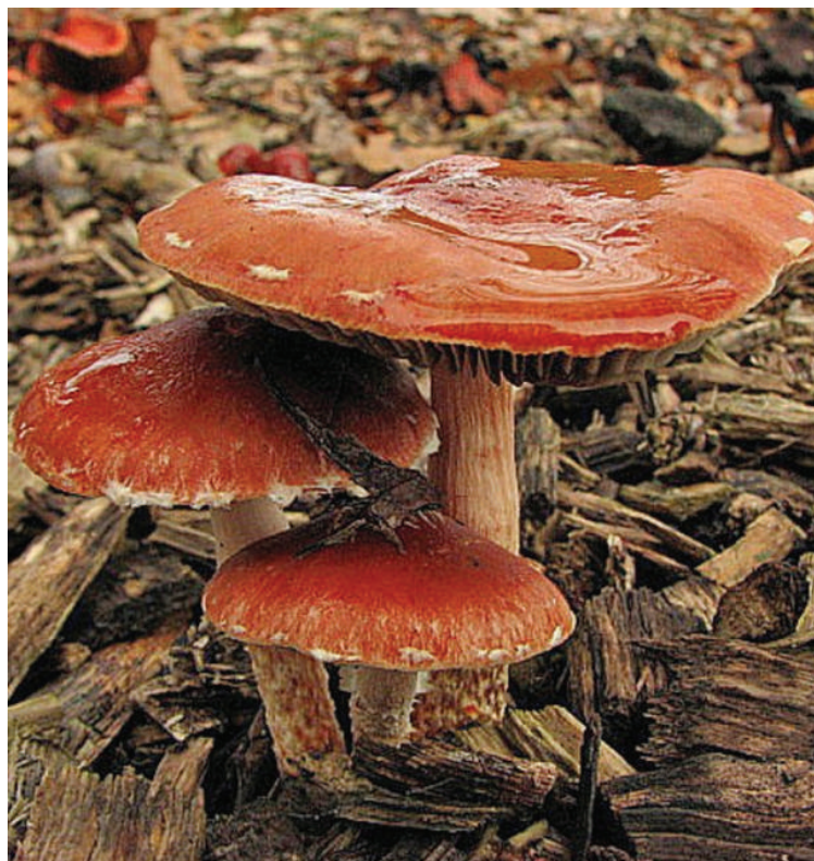
Oranjerode stropharia.

DNA-onderzoek bracht uiteindelijk de oplossing omtrent de oorsprong van de oranjerode stropharia dichterbij. Na grondig DNA-onderzoek is de soort nu namelijk, samen met een select groepje nauw verwante paddenstoelen, in een nieuw geslacht geplaatst en heeft daarmee haar nieuwe naam Leratiomyces ceres gekregen.