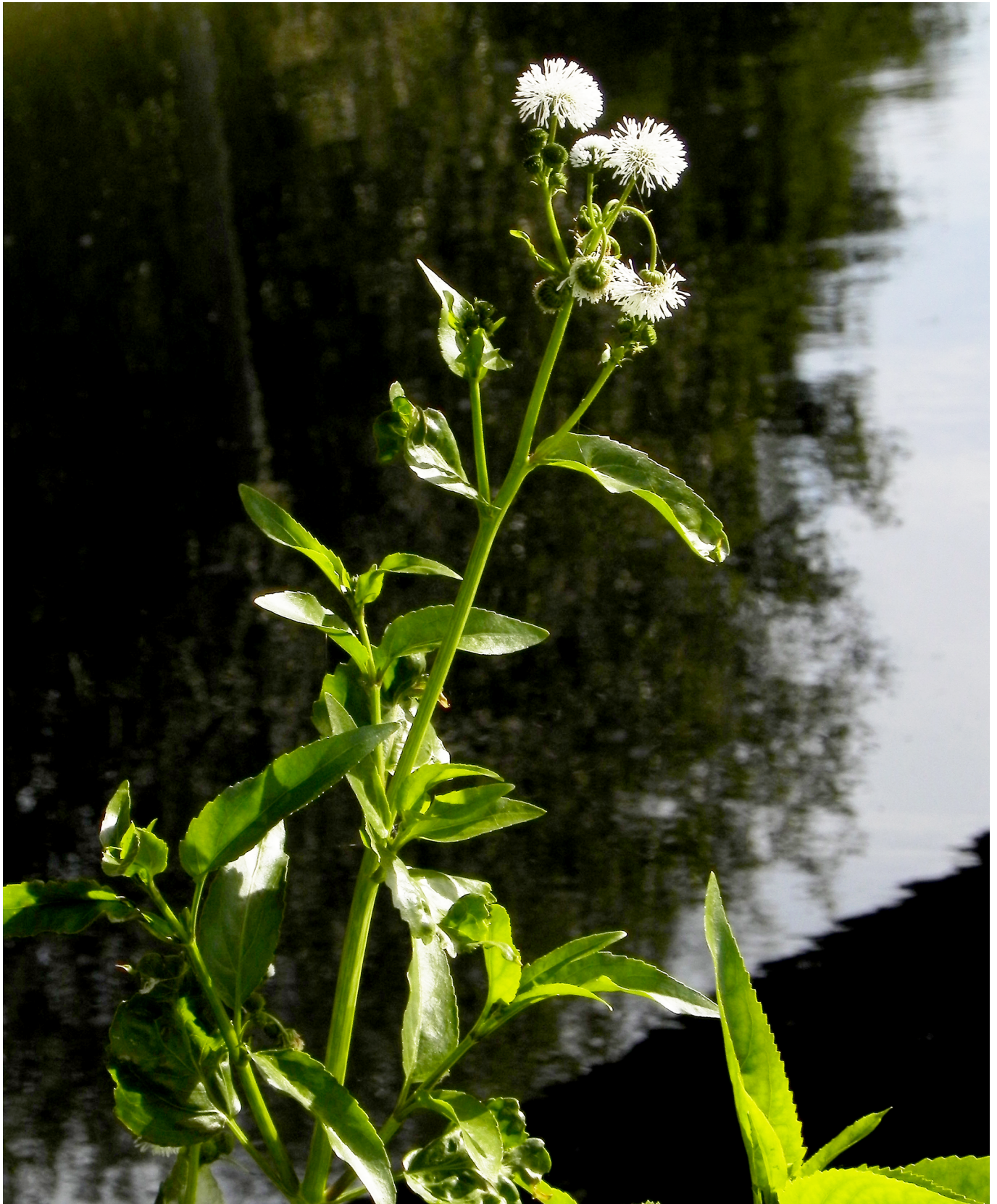
Fig. 2. Een stengel van Smalle theeplant ( Gymnocoronis spilanthoides (D. Don ex Hook. & Arn.) DC.) met bloeiwijze.

lange buisbloemen met een opvallend lange, ver buiten de bloemkroon uitstekende witte stijl en knotsvormige stempel. De soort bloeit door tot de eerste nachtvorst. Vrucht een sterk geribd nootje zonder pappus. — Fig. 1, 2 & 3