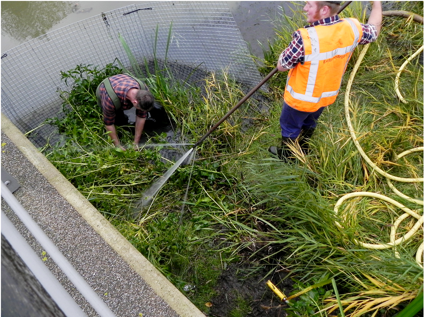
Fig. 5. Het losspoelen van de planten van Smalle theeplant ( Gymnocoronis spilanthoides (D. Don ex Hook. & Arn.) DC.) in Vleuten, 6 november 2019. De fijne ijzeren gaasmatten met een maaswijdte van 5 mm die voorkomen dat plantendelen weg gaan drijven tijdens het losspoelen, zijn voor de stevigheid gemonteerd op een frame van stevig metaalgaas met een maaswijdte van 5 cm.