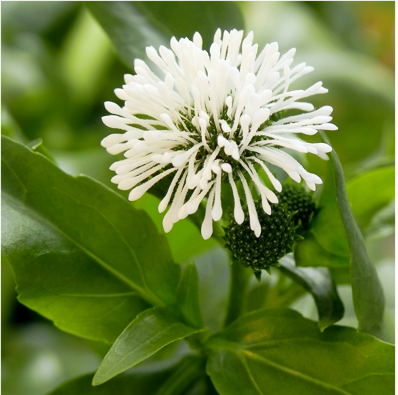
Fig. 3. Detail van een hoofdje van Smalle theeplant ( Gymnocoronis spilanthoides (D. Don ex Hook. & Arn.) DC.) met de opvallend lange stijlen met knotsvormige stempel.

wordt de soort gezien als een invasieve exoot. Recent is de soort in Europa ingeburgerd in Lombardije, Italië ( Champion et al. 2017 ).