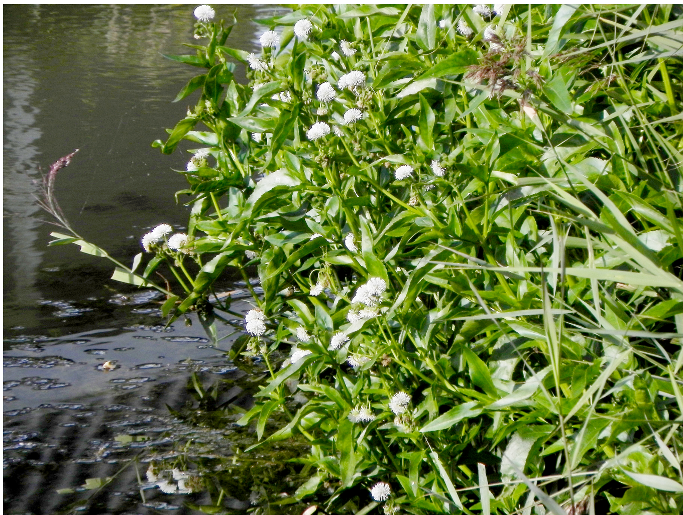
Fig. 1. Een pol van Smalle theeplant ( Gymnocoronis spilanthoides (D. Don ex Hook. & Arn.) DC.) tussen het riet op een oever.