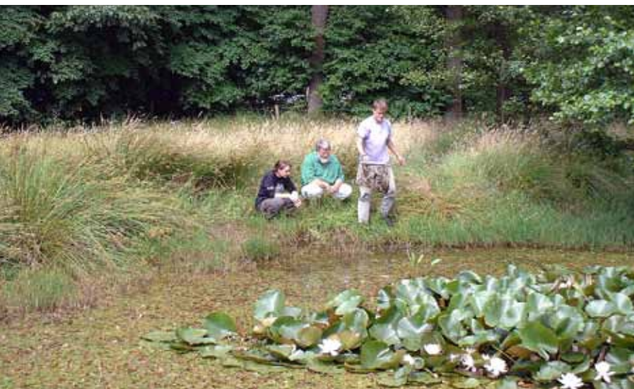
Monitoring van poelen

Het liefst gaan we uit van echte aantallen getelde dieren, omdat die de populatietrends het meest adequaat weergeven. Helaas is het bepalen van aantallen bij de meeste amfibiesoorten erg lastig tot onmogelijk. De trefkans wordt bij de meeste soorten sterk bepaald door de plaatselijke omstandigheden, waardoor, ondanks de standarisatie van de veldmethodiek, toch aanzienlijke variatie