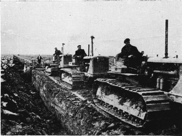
Zware machines bewerken het nieuwe land.

de natuurkrachten. De wetenschap is immers al sedert het begin van de drooglegging bezig te speuren naar alles, dat kan bijdragen tot verdieping van de kennis op het gebied der geologie, archaeologie, biologie, microbiologie en bodemkunde van de voormalige Zuiderzee, die haar geheimen langzaam prijs gaf. Men had geen tijd tot de nieuwe gronden in cultuur gebracht zouden zijn, maar men volgde de technici op de voet. Men maakte een dankbaar gebruik van de gelegenheid om navorsingen te doen in het maagdelijk gebied van de pas drooggevallen polder vóórdát de landbouw er beslag op kon leggen. Laten we hopen dat men er in slaagt