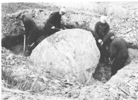
De grote kei van het Mazeveld bij Markelo.

Uiteraard zal het vervoer van de steen een paar Diepenheimse centen kosten, maar Stedeke zal er een attractie bij krijgen en dat is heel wat waard. Wanneer de steen zal worden overgebracht is nog niet bekend. In de Diepenheimse bossen ligt ook een dikke steen. Zeker zo groot als de Markelose en zelfs mooier van vorm. De Diepenheimse kei is aan de ene kant volkomen vlak. Men zou hem kunnen plaatsen met de vlakke kant naar boven, zodat men hem als tafel kan gebruiken." Tot zover het verslag. De schatting van het gewicht van de steen leek ons wel wat aan de optimistische kant. Indien de steen inderdaad een inhoud van 8 M^3 heeft, en overwegende dat het soortelijk gewicht van granieten tussen 2.5 en 3 ligt, dan zal het gewicht tussen de 20000 en 24000 kg. moeten liggen. We hebben hier dus met een gewicht te maken overeenkomende met een dertigtal volkswagens voorwaar een vrachtje waarbij de gemeente Diepenheim nog wel even de mouwen zal moeten opstropen! Wij zijn eens naar deze zware jongen gaan kijken. Komende van Diepenheim, even na kilometerpaal 21 bij "de Viersprong" gaat rechtsaf een weg naar Markelo. Bij het inrijken van een boerderij, zien we reeds grote zwerfstenen liggen. We bevinden ons hier dan ook in het gebied van het Mazeveld, waarvan in de oudere literatuur herhaaldelijk sprake is.