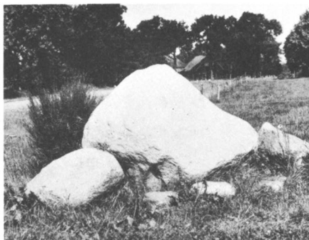
Bij het afgraven van een stuk bouwland, bij het erve Jolink in Stokkum, gem. Markelo, vond men daar enige zwerfkeien. Met behulp van een zware bulldozer heeft men de keien aan de ingang van een weiland, aan de provincialeweg Viersprong-Markelo geplaatst. juni 1962.