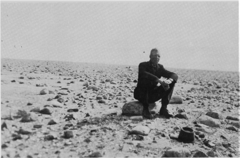
in de Noord-Oost Polder 1943.