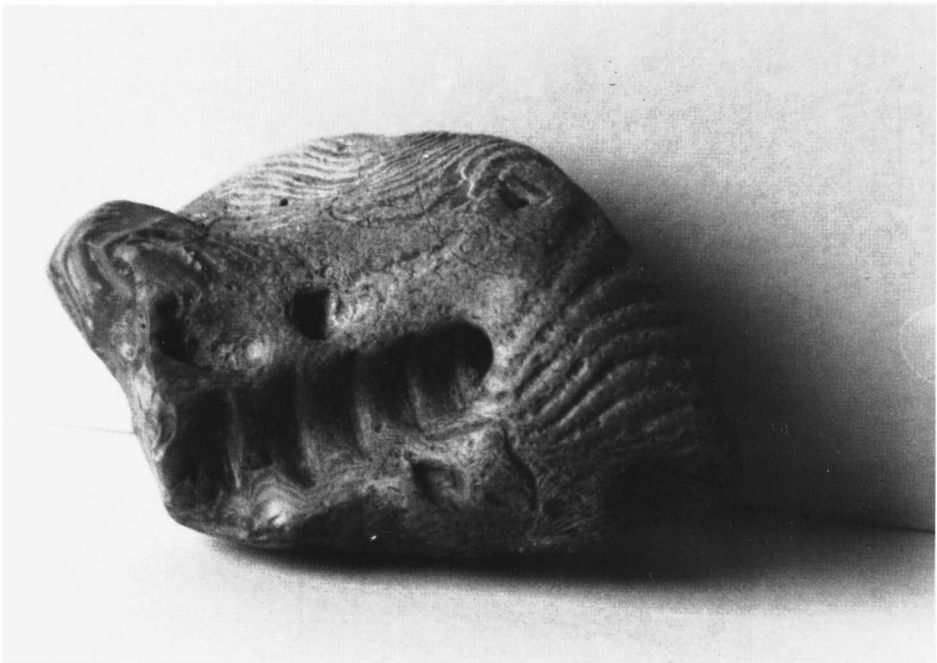
Fig. 2: De zijde met de grote afdruk; deze zet zich nog een kleine 4 cm in de steen voort.

Nu dan de steen waarover ik het in het bijzonder wil hebben. Vorig jaar vond ik hem in de buurt van de Besselinkschans - restanten van een militair bolwerk uit de tachtigjarige oorlog, maar nu in gebruik als crossbaan - onder Vragender. De mais was nog niet van het land, maar het had juist een paar dagen lekker geregend en ik speurde naar plekjes waar stenen te voorschijn gekomen konden zijn. Ik zag hem op een zandweg, aan de bosrand. Bij regen spoelt daar veel zand naar een lager gedeelte, zodat er telkens weer stenen zichtbaar worden. Er stak maar een puntje boven de grond uit, maar dat zag er merkwaardig genoeg uit om mij ertoe te brengen om de steen uit te graven. Ik weet nog dat ik dacht: 'Als je niet beter wist, zou je denken dat het een versteende mammoetkies is'. Thuis, na het afspoelen van de modder, werd de ware aard pas zichtbaar.