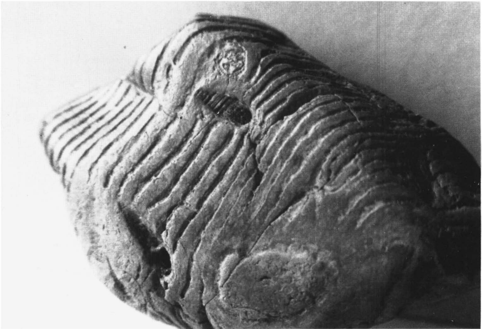
Fig. 3: In de gelaagde opbouw van de zwerfsteen valt de kleine afdruk van een slak goed op.