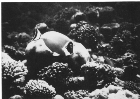
Foto 1: Een koraalrif in het Caribisch gebied, de vele duizenden vissen die op en van het koraal leven zorgen mede voor afbraak en transport van het materiaal. De vis boven het rif is een keizersvis.

Sinds 1900 hebben verschillende onderzoekers aangetoond dat slakken, wormen en sponzen ook in staat zijn koraal aan te tasten. In 1928 werd ontdekt dat ook de alikruik een steentje bijdroeg aan het erosieproces. HARTMAN ontdekte dit in 1958 van de boorspons, HUNT in 1969 van de rotsborende zeeëgel en tenslotte JAMES in 1970 van de worm Eunice schemacephala . De bio-erosie in zee is hierdoor goed beschreven. Uit gegevens blijkt, dat bijvoorbeeld sponzen in staat zijn om van één vierkante meter vaste ondergrond in 100 dagen zes kilo fijn sediment te schrapen en te boren. Dit komt maar liefst neer op een hoeveelheid van 210 ton per jaar! Ook vissen kunnen koraalrots met hun tanden afslijpen.