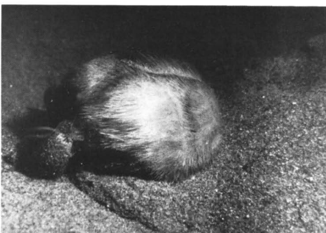
Foto 4: Ook zeeëgels zorgen voor afbraak en verplaatsing van bodemmateriaal.

vloedlijn van ons Noordzeestrand ligt, heeft vaak een lange geschiedenis achter de rug. Het gruis heeft ooit tot hele schelpen behoord die later vermalen zijn. Dit kan op drie manieren zijn gebeurd: