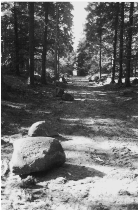
Afb. 4: Pad in het Kaapsche Bos waarlangs de collectie stenen van het oude monument ligt (1997).

Door Natuurmonumenten is aangegeven dat deze verzameling deel mag uitmaken van het nieuw op te richten 'Stenenmonument Maarn'. Dit betekent dat ze terug zullen gaan naar de plaats van herkomst, namelijk de zandafgraving of daar in de buurt. Ook worden ze weer gevoegd bij het gezelschap stenen, waaruit ze ooit geselecteerd werden.