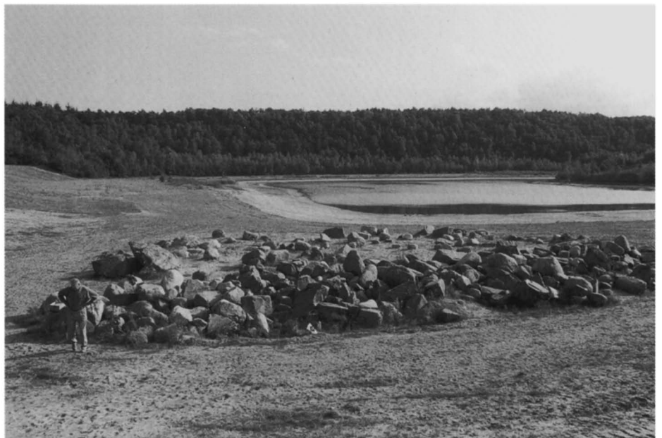
Afb. 5: De stenencollectie in de zandafgraving in 1998.

Verder is gebruik gemaakt van het 'Archief Vereniging Natuurmonumenten' in het Gemeentearchief van Amsterdam.