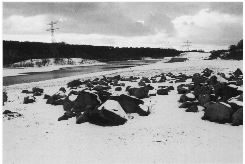
Afb. 2: Overzicht van de Zanderij, winter 1999.

Een aantal zaken rond dit stenenmonument staan beschreven in de biografie van Jhr. W.H. de Beaufort (Pelzers, 1996). Het park was moeilijk toegankelijk: je moest vooraf schriftelijk een toegangsbewijs aanvragen bij Natuurmonumenten in Amsterdam en je moest natuurlijk wel lid zijn. Er was een lijst met de namen van de genummerde stenen voorhanden. Het 'Geologisch Park' gold stellig als