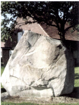
Afbeelding 1: De zandstenen zwerfsteen bij Steinfurt.

Zwerfstenen zijn er in soorten en maten. Het meest markant zijn echter de zeer grote exemplaren die op meerdere plaatsen her en der in het landschap te zien zijn. 'Findlinge in Nordrhein-Westfalen und angrenzenden Gebieten' van Eckhard Speetzen is een interessant boek dat zich bezig houdt met zeer grote zwerfstenen die tijdens de Saale ijstijd vanuit Scandinavië naar zuidelijker gelegen gebieden zoals Noord-Duitsland zijn getransporteerd. Het boek geeft een overzicht van stenen die een doorsnede van twee meter of meer hebben en die voorkomen in het gebied tussen Rijn en Weser. Dat gekozen is voor exemplaren met een dergelijke doorsnede komt omdat anders veel te veel stenen beschreven hadden moeten worden, namelijk meerdere duizenden. Dit wil echter niet zeggen dat in dit boek nu alle zwerfstenen uit de gekozen grootte-categorie voorkomen. Het werk moet eerder gezien worden als een tussenbalans van de stenen die tot nu toe bekend zijn. Het is best mogelijk dat het boek in de toekomst nog een vervolg gaat krijgen. Belangrijk is dat in dit boek deze zwerf-