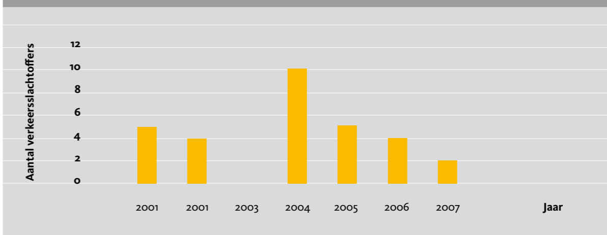
Figuur 2: Aantal verkeersslachtoffers van de ringslang op de Westbergweg (Wageningen) voor (< 2006) en vanaf (≥ 2006) aanleg van de faunavoorzieningen.

by the installation of tunnels. This was also done at the Westerbergweg in Wageningen, the Netherlands, which is situated on the transition of river foreland and glacial deposits. Discussion arose whether these tunnels and the drift fences could possibly be barriers for grass snake migration. By means of sand tracks we therefore monitored the movement of grass snakes through two semi-open amphibian tunnels (type Aco AT500). The field work was conducted between April and October in 2006 and 2007. A total of 46 grass snake tracks were found in the tunnels during 312 control days. Although tunnel acceptance by grass snakes was proven, the tunnel/fence system did not significantly reduce road kills (Kolmogorov-Smirnov test; P > 0,05 ). After installation, small but quite similar numbers of grass snakes as those prior to the installation were still killed by traffic. This is probably due to the inappropriate fencing which should prevent snakes from reaching the road and guide them towards the tunnels.