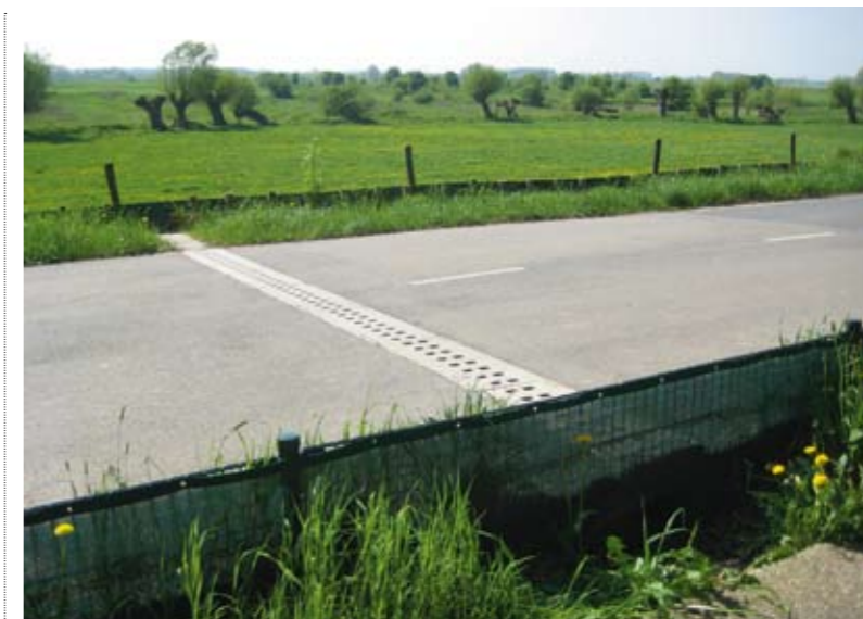
Faunavoorzieningen op de overgang van stuwwal naar uiterwaarden

Het patroon van maandelijkse spoorvondsten kan in redelijke mate worden verklaard door de ecologie van de ringslang. De piek in augustus en september 2006 wordt waarschijnlijk veroorzaakt door migratie vanuit zomerhabitats (de uiterwaarden) richting de overwinteringslocaties (de stuwwal). Ditzelfde patroon is ook in 2007 vastgesteld. Het ontbreken van een voorjaarspiek in 2006, waarbij dieren naar de zomerhabitats migreren, kan deels worden verklaard doordat de voorzieningen pas eind april 2006 gereed waren. Door het ontbreken van geleidingsschermen in die periode, konden ringslangen de tunnels nog moeiteloos omzeilen. In 2007 doet de eerste piek zich voor in mei en juni. Deze piek kan (mede)