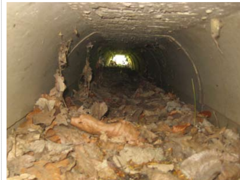
Deels open tunnel (type Aco AT500) met strooisel op bodem

worden verklaard doordat vrouwtjes in die periode op zoek gaan naar eiafzetplaatsen en daarbij soms grotere afstanden afleggen. Hoewel de gepresenteerde resultaten duidelijk maken dat de kleine, deels open amfibietunnels op de Westbergweg door ringslangen worden gebruikt, mogen de faunavoorzieningen op de Westbergweg beslist niet als ideaal voor ringslangen worden bestempeld. De resultaten tonen acceptatie van desbetreffend tunneltype aan, maar het systeem als geheel functioneert niet optimaal, getuige het aanhoudend aantal verkeersslachtoffers ter plaatse.