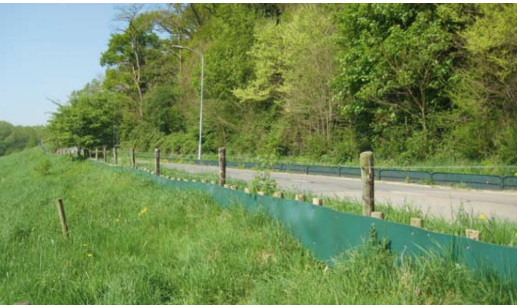
Geleidingsschermen langs de Westbergweg

overbrugging beperkt (6,5 meter) en betreft het een secundaire weg met een betrekkelijk lage verkeersintensiteit. Onder vergelijkbare omstandigheden zijn in het Fochteloërveen en het Drents Friese Wold ook ringslangpassages in kleine faunatunnels waargenomen (Struijk & Mulder, in prep. ; Mulder, 2010). Het betreft hier open amfibietunnels met een metalen afdekrooster. De lichtinval is daar vele malen groter dan in het type Aco AT500. Hoewel meerdere typen kleine tunnels worden geaccepteerd, wordt benadrukt dat het gebruik hiervan niet zonder meer voor iedere situatie is aan te raden. Waar mogelijk, in het bijzonder bij