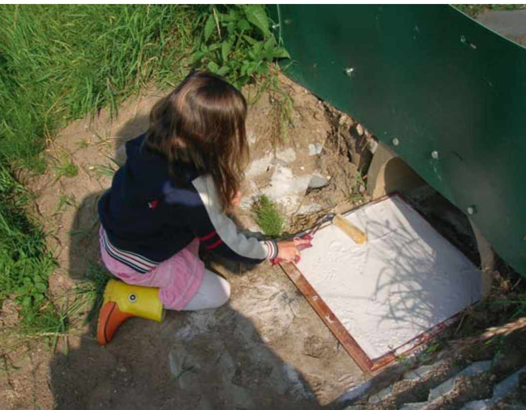
Zandbedmethode waarbij na iedere spoorcontrole het zilverzand wordt glad gestreken

van de faunavoorzieningen varieerde van nul tot tien per jaar. In 2006 en 2007 zijn respectievelijk vier en twee doodgereden ringslangen geteld.