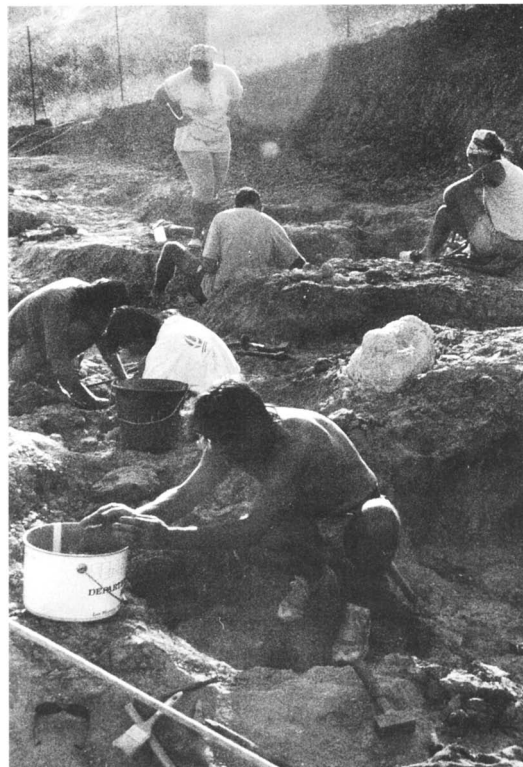
Afb. 2. Belle-Vue-site. De hele opgraving draait op vrijwilligers (paleontologen, paleontologie-studenten).

De opgraving, de 'Belle-Vue-site' ligt bij Campagne-sur-Aude, 3 km ten zuiden van Espérazza. Afb. 1. Hier zijn fluviale (rivier-) afzettingen van Boven-Krijt (Maastrichtien)-ouderdom ontsloten. Al in het eind van de vorige eeuw werden in de omgeving van Campagne-sur-Aude enkele resten van dinosauriërs gevonden. Veel aandacht werd daar niet aan besteed. Pas in 1983 werd een nieuwe inventarisatie van de dinosaurius-vindplaatsen gehouden. De rijkdom van de zogenaamde C3-locality (Belle-Vue) bleek een opgraving op grotere schaal te rechtvaardigen. Sinds 1989 wordt daar iedere zomer gegraven. In 1992 kon het Musée des Dinosaures in Espérazza geopend worden. Het oppervlak van de opgraving werd in 1994 met behulp van een bulldozer vergroot. Sinds dit jaar is ook de opgraving voor publiek toegankelijk. Het is momenteel de enige dino-opgraving op deze schaal in Europa. Afb. 2.