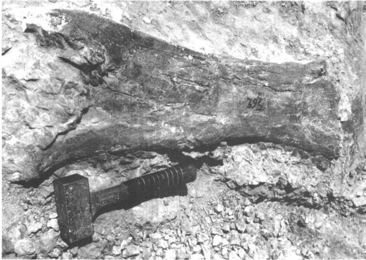
Afb. 3. Een dijbeen van een titanosauriër, 71 cm lang.

dan wordt het eerst met een kunsthars-alcohol-oplossing geïmpregneerd om het geheel te verstevigen. Ieder bot wordt genummerd; de positie, de oriëntatie en de laag waarin het bot zich bevindt worden opgenomen en genoteerd. Afb. 3. Om het bot heen wordt een sleuf gehakt zodat het bot op een 'zuiltje' komt te staan. Daarna wordt het zuiltje ingepakt in een jute-gipsverband. Het zuiltje wordt in zijn geheel losgehakt en naar het laboratorium gebracht. Daar wordt het bot verder uitgeprepareerd. Afb. 4. Het laboratorium is van het museum gescheiden door een grote glaswand, zodat het preparerewerk ook voor het publiek zichtbaar is.