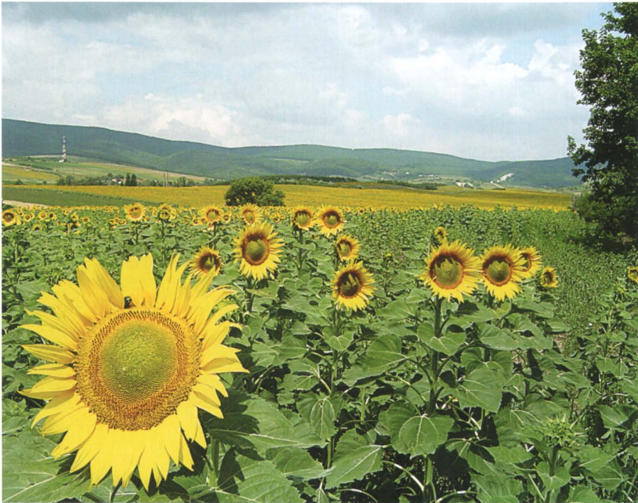
Afb. 1 – 1. Landschap in de omgeving van Salgótarján in de Alföld.

De puszta van de Grote Hongaarse Laagvlakte is een vrij monotoon, vlak steppengebied met af en toe een heuveltje. Bij Fülöpháza is het Kiskunság Nationaal Park ingericht, waar wandelende zandduinen te vinden zouden zijn. Dit park is te bereiken vanuit Vajta, aan de Donau-zijde van de puszta. Op hier en daar een veld zonnebloemen na is het ook een vrij kleurloos en soms dor gebied, afgewisseld door rietkragen en moerassen. Afb. 1 - 1. Je kunt er zelfs nog verdwalen, iets wat ons overkwam. (Gelukkig komt uiteindelijk elk zandpad wel weer op een verharde weg uit, maar we bleken intussen tientallen kilometers afgedwaald te zijn.)