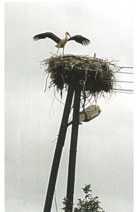
Afb. 1 – 2. Ooievaar op nest bij Hortobágy.

In het Hortobágy Nationaal Park broeden in het voorjaar talrijke vogelsoorten en het biedt aan trekvogels een rustplaats. Het gebied heeft veel te bieden aan vogelaars, die aalscholvers, reigers, buizerds, visarenden en natuurlijk ooievaars en nog vele andere vogelsoorten door hun verrekijkers te zien krijgen. Afb. 1 - 2. Hoer je vanuit het gras een soort rateltje met hoge tonen, dan is dit de waterrietzanger. Ook voor entomologen en bewonderaars van de wilde flora is het gebied aantrekkelijk, want er komen veel bijzondere insecten- en bloemsoorten voor. Er zijn in het park grote en kleine visvijvers; het gebied dat uit nat bonk-