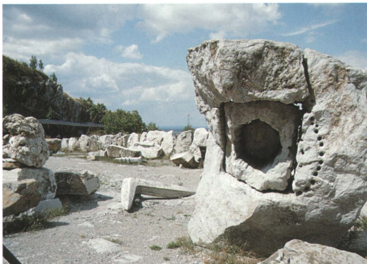
Afb. 1 - 4. De voormalige groeve te Nagyharsány in Zuid-Hongarije, nu ingericht als beeldtentoonstelling.

Afb. 1 - 5. Postzegel van de ammoniet Reineckeia crassicostata , Callovien (Midden-Jura), bij Villány uit 1969.