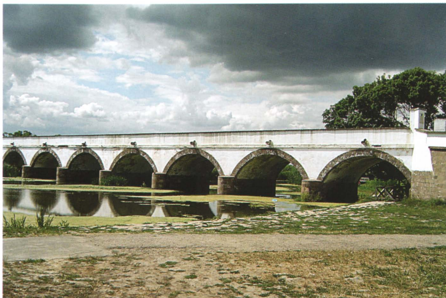
Afb. 1 – 3. De Negen-bogenbrug van Hortobágy.

Al is in de Alföld dan weinig geologisch te beleven, één aspect van de Grote Hongaarse Laagvlakte willen we wat beter bekijken. De rivier de Tisza is er de belangrijkste waterloop. Deze heeft zijn bedding herhaaldelijk verplaatst en deze veranderingen hebben sporen in het land achtergelaten. Hieraan is het volgende artikel gewijd.