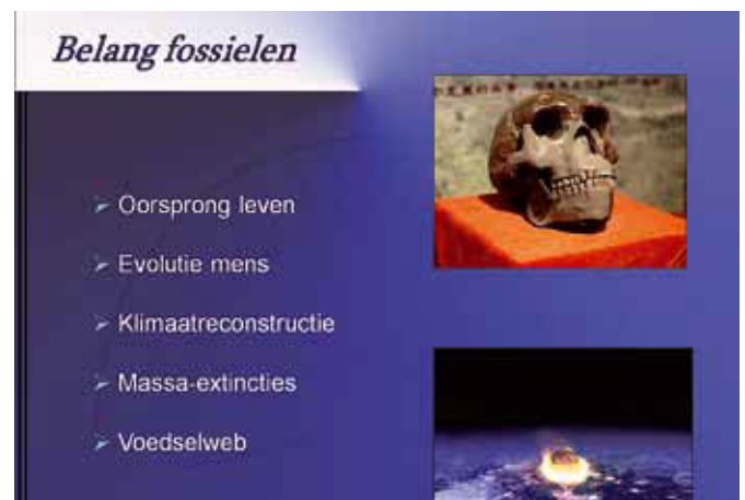
Afb. 4. Een goed georganiseerde dia: een kopje, niet te overheersende achtergrond, duidelijke figuren, weinig tekst, tekst met bullets en spatie ertussen. Een typische dia voor de spreker om een paar minuten aan te wijden.

toont u een dia van bijvoorbeeld een fossiele schildpad, dan kan het minder dan de 'standaard' tijd worden. Die 1-2 minuten is meer een vuistregel. Zelf heb ik ooit een presentatie van ongeveer 70 dia's gegeven in 13 minuten. Grafisch spektakel over vulkanen, maar het was een race tegen de tijd. Bij elke 15 seconden een nieuwe dia komt de boodschap minder over. Vaak is er bij een bijeenkomst een bepaalde tijdslimiet ingebouwd. Gaat u er (teveel) overheen dan loopt u de kans