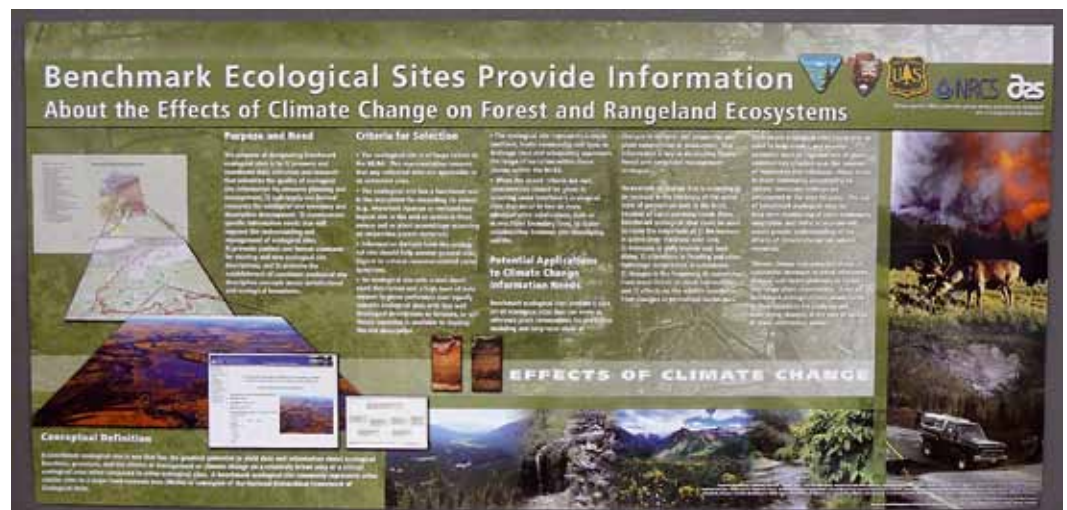
Afb. 7. Schitterende foto's, goede achtergrond, ruimte, en duidelijk waar u begint met lezen. Een plaa'tje van een poster.

steeds leesbaar? Zorg verder voor een goede koker op weg naar de posterbijeenkomst zodat de poster niet beschadigd raakt. En punaises zijn altijd handig voor het ophangen.