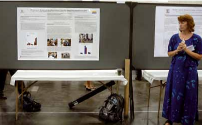
Afb. 6. Deze dame heeft een schitterende jurk, maar die past minder bij haar voornamelijk witte poster dan bij een poster met een blauwtint. De groene achtergrond en de witte tafel hebben ook n iet bijgedragen aan een harmonieus geheel.

De aardwetenschappen zijn bijzonder geschikt om iets aan uw toehoorders te laten zien. Hoewel het niet heel gebruikelijk is