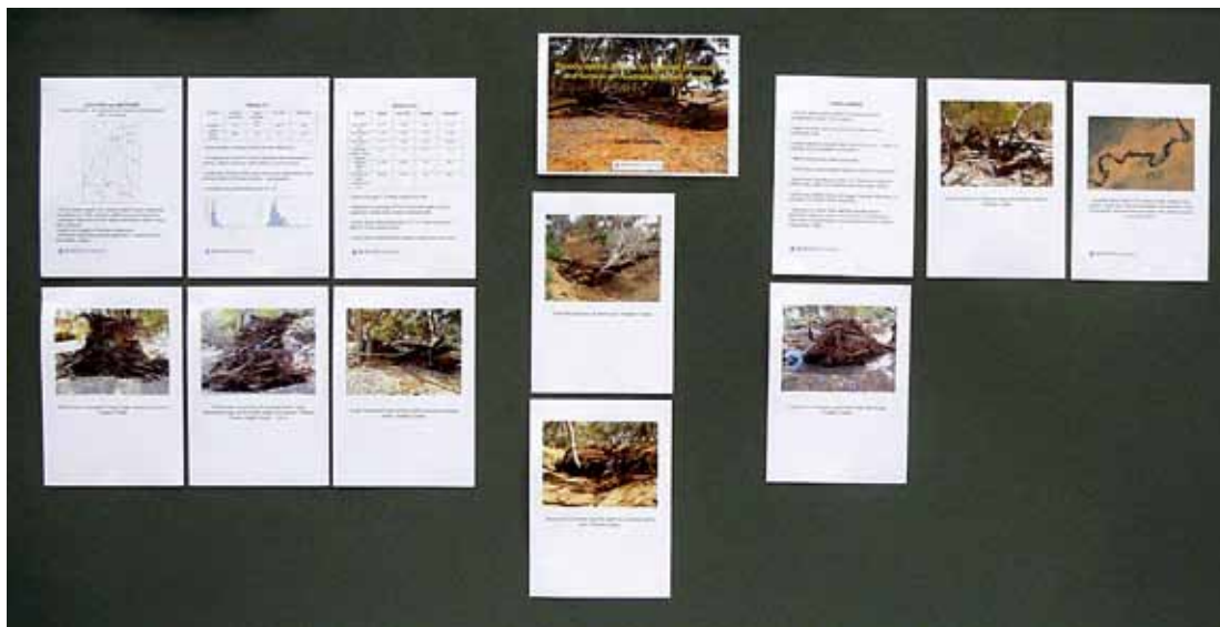
Afb. 1. In het verleden was dit een bekendere manier van presenteren, maar tegenwoordig is dit een negatieve uitzondering.

Vermeld de auteurs inclusief de instelling of affiliatie onder de titel of subtitel. Voornamelijk is een goed idee zodat de bezoeker weet hoe hij/zij u kan aanspreken, mocht u geen naamplaatje hebben. Het emailadres van de eerste auteur is heel handig voor als mensen contact met u willen opnemen na de poster-sessie. Zorg bij meerdere auteurs wel voor overzicht door ze direct onder elkaar te plaatsen.