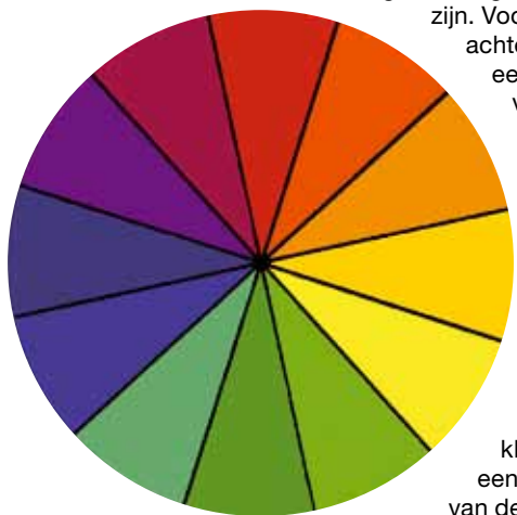
Afb. 4. De kleurencirkel.

Denk bij de keuze van de achtergrondkleur aan de kleuren van de foto's op de poster. Zijn deze rood, dan is een lichte tint van paars niet de meest voor de hand liggende keuze. De achtergrond mag niet te opvallend zijn. Voorbeelden van een achtergrondkleur zijn een roodoranje tint voor een poster over vulkanen, terwijl blauw heel goed kan werken bij een poster over zeeleven. Een leuk patroontje kan uw poster wat meer jus geven. Belangrijk detail is dat de kleuren het beste een groot oppervlak van de poster kunnen bestrijken. Anders wordt het te onrustig.