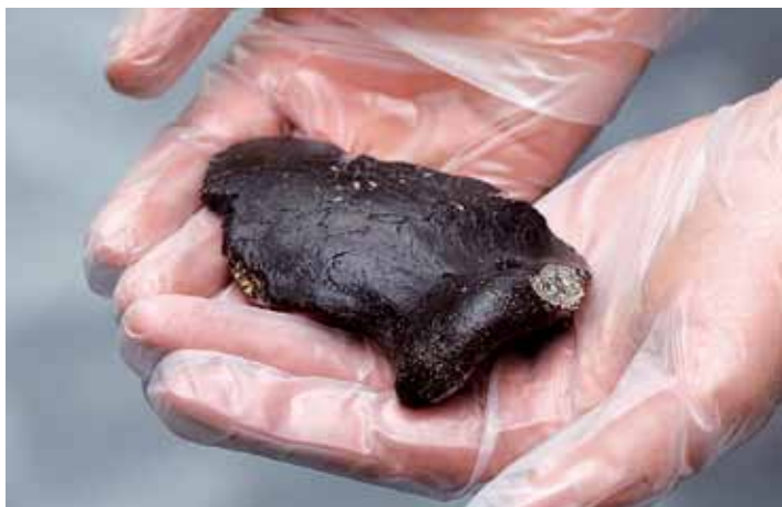
Afb. 1. Schedelfragment van de als Krijn gedoopte Neanderthaler.

Waarschijnlijk liepen er iets minder dan een miljoen jaar geleden al mensachtigen rond in dit deel van West-Europa. Overblijfselen van deze mensachtigen liggen mogelijk onder meer begraven onder een dik pakket sedimenten in de bodem van de Noordzee. Pas met een nieuwe ijstijd, ver in de toekomst, als de Noordzee weer droog zal vallen, komt dit archeologisch archief beschikbaar. Met de zandwinning op de Noordzee voor onder andere de Tweede Maasvlakte, komen echter nu sporadisch al fossielen van de vroege mens boven water, zoals het schedeldak van de tot 'Krijn' gedoopte Neanderthaler die in juni 2009 gevonden is. Afb. 1. Dit interview met Wil Roebroeks, hoogleraar Archeologie aan de Universiteit van Leiden, gaat over vroege mensachtigen in ons land en de archeologie van de Noordzee.