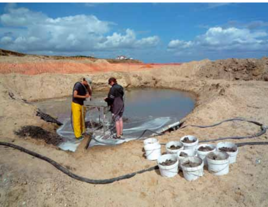
Afb. 5. Het zeven van de rivierafzettingen op zoek naar artefacten en fossiele botten langs de Engelse kust bij Norfolk. Door kusterosie zullen de huizen op de achtergrond binnenkort in zee vallen!

Dan zou ik het onderzoek aan de Engelse oostkust willen uitbouwen en dat als startpunt nemen om het hele Noordzeebekken beter aan te pakken. Afb. 5. Nederland doet schandelijk weinig aan de archeologie van de Noordzee. Vooral over het zuidelijk deel van de Noordzee is weinig bekend omdat daar weinig olie en gas zit. De Maasvlakte die nu wordt opgespoten biedt enorme kansen. Het is een project waar erg veel geld in omgaat, maar er gaat slechts een heel klein bedrag naar het archeologisch onderzoek. Zo'n groot gebied als hier nu wordt ontgonnen is voor Nederland ongekend. De groeve die hier door zuigwerkzaamheden ontstaat, is groot, denk aan een paar duizend voetbalvelden en dan 10 meter diep! Begeleiding vanuit de archeologie ontbreekt vrijwel geheel. Op landlocaties is archeologisch vooronderzoek tegenwoordig wel verplicht. Voordat je zo'n groeve in zee