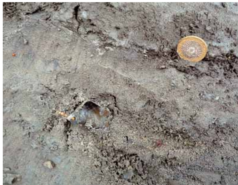
Afb. 2. Vuursteenafslag, gevonden in ca half miljoen jaar oude riviersedimenten voor de oostkust van Engeland. Voor de schaalaaanduiding is een Britse munt van 2 pond gebruikt.

Er is in de geschiedenis een voortdurend komen en gaan geweest van mensen, en belangrijker nog, een voortdurend veranderen van de land-zee verdeling. Om te praten over 'de eerste Nederlander' vind ik niet zo zinvol. Vanuit het perspectief van de prehistorie zijn we allemaal allochtonen. Veertigduizend jaar geleden leefde hier de Neanderthaler, die plaats heeft gemaakt voor de Homo sapiens . Op grond van DNA-analyse weten we inmiddels dat de eerste boeren, die zich hier 7000 jaar geleden vestigden, niet verwant waren aan de lokale jagers-verzamelaars die hier toen leefden.