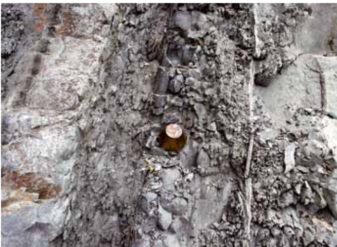
Afb. 7. Een 'golden spike', of GSSP, markeert de basis van een etage. De GSSP (de afkorting van Global Boundary Stratotype Section and Point) op de foto geeft de ondergrens van het Thanetien aan, de jongste etage van het Paleoceen.

Landschappelijk gezien is de KT-grens in Zumaia wereldwijd het mooist, vindt Smit, die een van de grondleggers is van de theorie over de meteorietinslag die 65 miljoen jaar geleden een