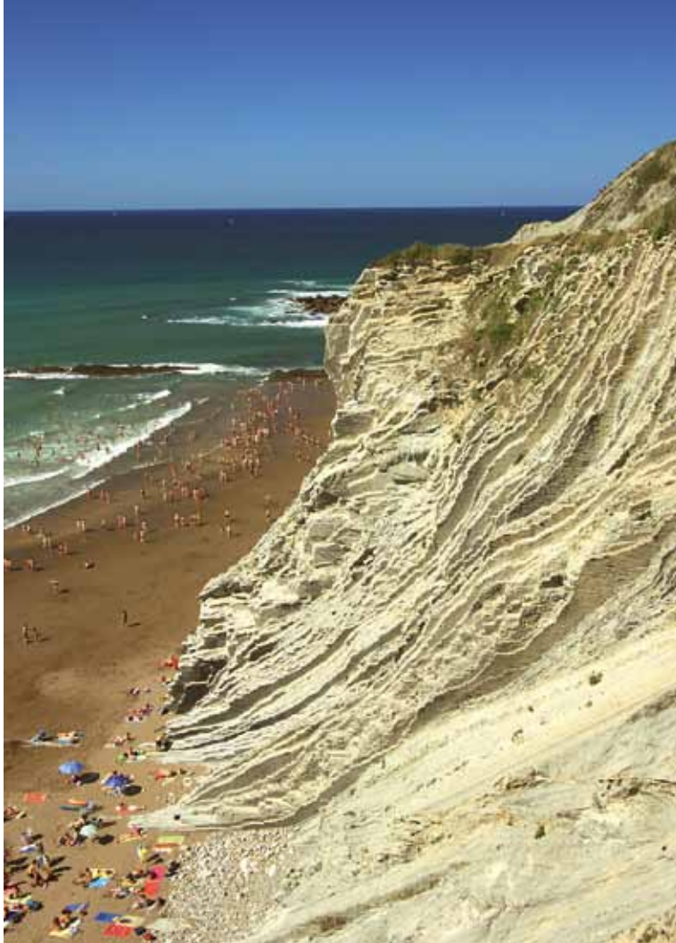
Afb. 4. Eocene lagen in Zumaia.

strand van Zumaia ook de grens tussen Paleoceen en Eoceen zichtbaar. Hordes toeristen lopen er op zonnige dagen langs. Sinds kort kan de onwetende Spaanse toerist zien dat hij/zij op een bijzondere plek het badlaken uitrolt. Bij de entree van het strand is een levensgroot informatiepaneel geplaatst waarop de lokale kustlijn en de corresponderende geologische gebeurtenis is weergegeven, met uitleg in het Baskisch en Spaans.