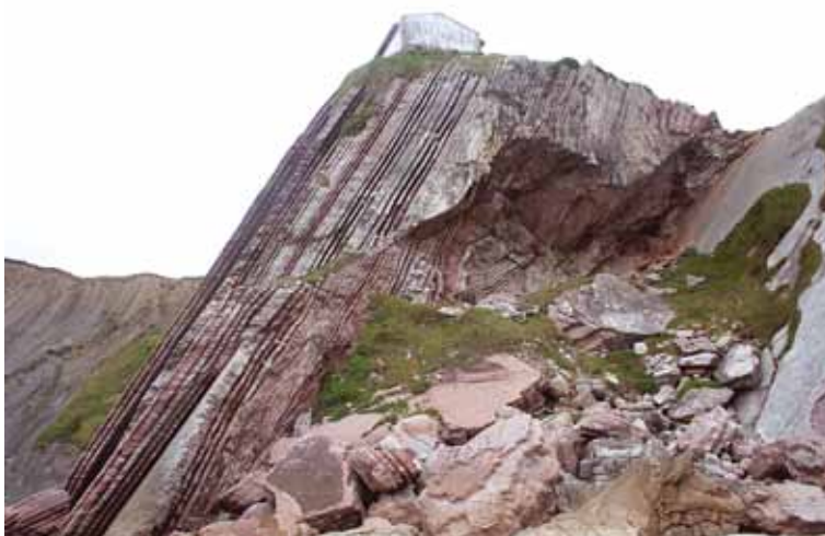
Afb. 10. Onder het op de kliffen gelegen kerkje van San Telmo is een patroon van astronomische cycli in het gesteente zichtbaar: een reeks smalle banden en een brede band wisselen elkaar af; de totale cyclus duurt 100.000 jaar, corresponderend met de baan van de aarde om de zon die varieert tussen een cirkelvorm (brede band) en een maximale ellips (smalle banden).

Zes jaar geleden trok Baskenland nog nauwelijks toeristen met een bovengemiddelde geologische belangstelling; nu ligt het bezoekersaantal al op 20.000 toeristen per jaar. De beste manier om het gebied te bezoeken is het maken van een kustwandeling; ook kunnen de (meestal Spaanse) toeristen een informatiecentrum over geologie bezoeken en een educatieve boottour langs de kust maken. Omdat grote delen van de kust van zowel Spaans als Frans Baskenland spectaculaire kustkliffen omvatten, bestaat het idee om langs de hele Baskische kust, van het Franse Biarritz helemaal tot aan Bilbao, een 150 kilometer lang thematisch 'geopad' te bewegwijzieren. Voor Baskenland zou de bijzondere geologie een uitbreiding kunnen vormen op de gastronomie, nu een van de belangrijkste trekpleisters voor vakantiegangers. Met zo'n 'geopad' zou Baskenland een goede tegenhanger zijn van de overburen aan de andere kant van de Atlantische Oceaan. Daar ligt de Britse 'Jurassic Coast' , die het hele Mesozoïcum omspant en op de Werelderfgoedlijst staat.