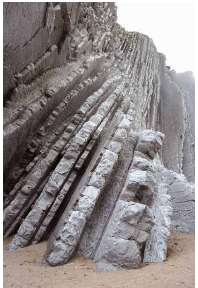
Afb. 8. Boorgaten in de bijna verticaal gestelde kalksteenlagen uit het jongste Selandien, tussen de twee golden spikes op het strand van Zumaia (links onder).

"Dankzij moderne dateringstechnieken hebben geologen alle lagen uit het Paleoceen nauwkeurig kunnen dateren," vervolgt Smit. "Dat is nog niet gelukt voor het jongste, en dus bovenste Krijt. Een nadeel van zowel de Tunesische als Spaanse sedimenten is dat het magnetisch signaal van de mineralen