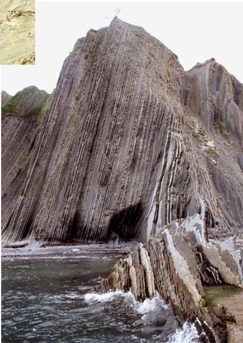
Afb. 5. Verticaal gestelde lagen uit het Onder-Eoceen, enkele tientallen meters links van de Paleoceen/Eoceen-grens, op het strand van Zumaia.

Overal in de Paleocene sedimenten herinneren boorgaten aan het nemen van paleomagnetische monsters in de afgelopen decennia (afb. 8). De ijzerhoudende mineralen in het gesteente bevatten het bewijs van de ompolingen: de 'kompasnaaldjes' in de ijzerdeeltjes wijzen afwisselend in noordelijke of zuidelijke richting. De boorgaten in de dikke kalkstenen balken lopen door tot ver na de volgende spike, 30 meter verderop, die de grens tussen het Danien en Selandien markeert op 61,1 miljoen jaar geleden (afb. 9). De corresponderende geologische gebeurtenis was een wereldwijde, plotselinge daling van het zeeniveau.