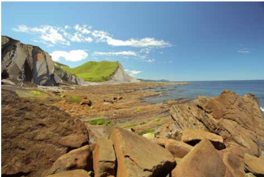
Baskische kust vanaf Zumaia in westelijke richting.

door Annemieke van Roekel avroekel@xs4all.nl