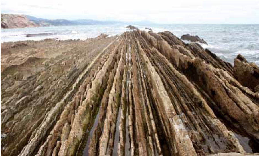
Afb. 6. De in zee doorlopende en geërodeerde verticaal gestelde lagen van afbeelding 5.

grotendeels verdwenen is doordat de sedimenten kilometers diep in de aardkorst begraven zijn geweest. Naarmate je dieper in de aarde komt, des te warmer het is. Hierdoor is niet alleen het magnetische signaal verdwenen, maar ook de kwaliteit van de fossielen aangetast.”