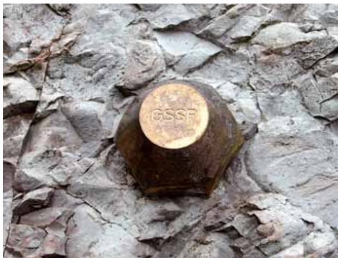
Afb. 9. Deze golden spike geeft de ondergrens van het Selandien aan, de middelste etage van het Paleoceen.

einde zou hebben gemaakt aan het tijdperk van de dinosaurïers. In Zumaia is hij sinds ruim dertig jaar met enige regelmaat te vinden, maar ondanks het vele onderzoekswerk heeft de KT-grens in dit deel van Baskenland zijn geheimen nog niet allemaal prijsgegeven.