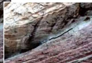
Afb. 3. Detail van afb. 2. Het iridiumrijke kleilaagje van de KT-grens is op de foto gemarkeerd.