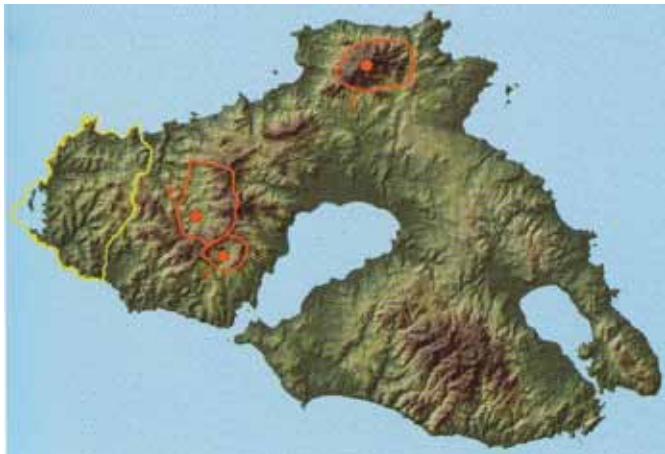
Afb. 1. Op Lesbos liggen drie vulkanische centra die tijdens het vroege Mioceen hun grootste activiteit kenden. De Vatousa-vulkaan (rood gemarkeerd met 2) is de belangrijkste bron van het vulkanische gesteente dat het Lesbos Petrified Forest (geel omlijnd) bedekt.

door Annemieke van Roekel E-mail: avroekel@xs4all.nl