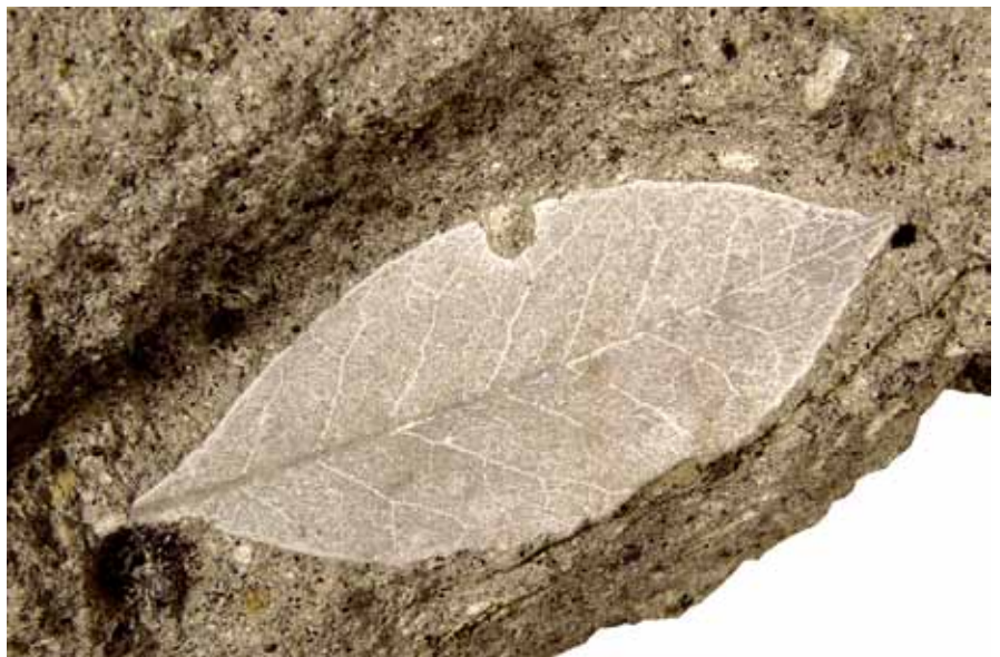
Afb. 4. Afdruk van een laurierblad in vulkanische gesteente. Laurier was een veel voorkomende soort in de subtropische bossen in het Egeïsche gebied tijdens het vroege Mioceen.

Verschillende sites zijn inmiddels voor het grote publiek ontsloten en bewegwijzerd. Ook wetenschappers werken op deze locaties. Hier liggen verkiezelde boomstammen tot wel 20 meter lang. Sommige werden meegesleept in de modderstromen die door regenval ontstonden en de vulkanische as van hoger gelegen delen naar beneden transporteerden. Andere boomstronken staan op dezelfde plek als waar ze ooit groeiden, soms met een zichtbaar en 'intact' wortelstelsel. Zie de afbeeldingen A t/m G op pagina 83 en 84.