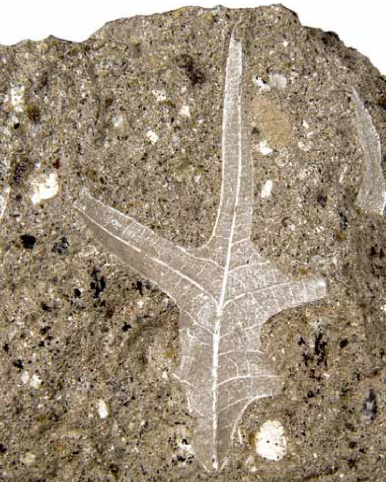
Afb. 3. Gefossiliseerd blad ( Pungiphyllum cruciatum ) van een aan de eik verwante soort.

van een Pliniaanse heftigheid; de hele kegel werd weggeblazen en een grote caldera werd gevormd. Het gebied met gefossiliseerde boomstronken – ten westen van het in de krater gelegen dorpje Vatousa – beslaat een totale oppervlakte van 15.000 ha (ca 10 x 15 km). De grootste concentraties versteende bomen liggen tussen de plaatsjes Sigri, Antissa en Eresos – beroemd als geboorteplaats van zowel de Griekse dichteres Sappho als de filosoof Theophrastos, die al omstreeks 300 v.C. over (boom-)fossielen heeft geschreven.