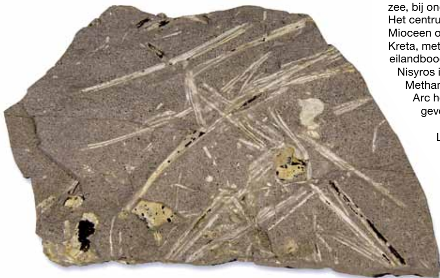
Afb. 2. Gefossiliseerde naalden van een voorloper van de den.

Het landschap in de buurt van het plaatsje Sigri, op het westelijk deel van het Griekse eiland Lesbos, is heuvelachtig en kaal. Hier en daar steken eenzame boomstronken uit de vulkanische bodem. Zonder geologische voorkennis is het een onopvallend gebied. Deze onvruchtbare plek in de oostelijke Egeïsche Zee was in het verre verleden onderdeel van de continentale landmassa Aegiis, begroeid met dichte oerwouden van sequoia, den, palmboom, walnoot, eik, cipres en kaneelstruik. De bossen reikten van wat nu Noord-Griekenland is, tot ver in Turkije. Ter plaatse van Lesbos lagen in het vroege Mioceen drie vulkanische centra, die tussen 21,5 en 16 miljoen jaar geleden hevige uitbarstingen kenden. In die periode zijn de sequoia- en dennenwouden op Lesbos met dikke lagen hete vulkanische as bedekt. Erosie van deze aslaag bracht de versteende bomen al in de oudheid weer aan het licht.