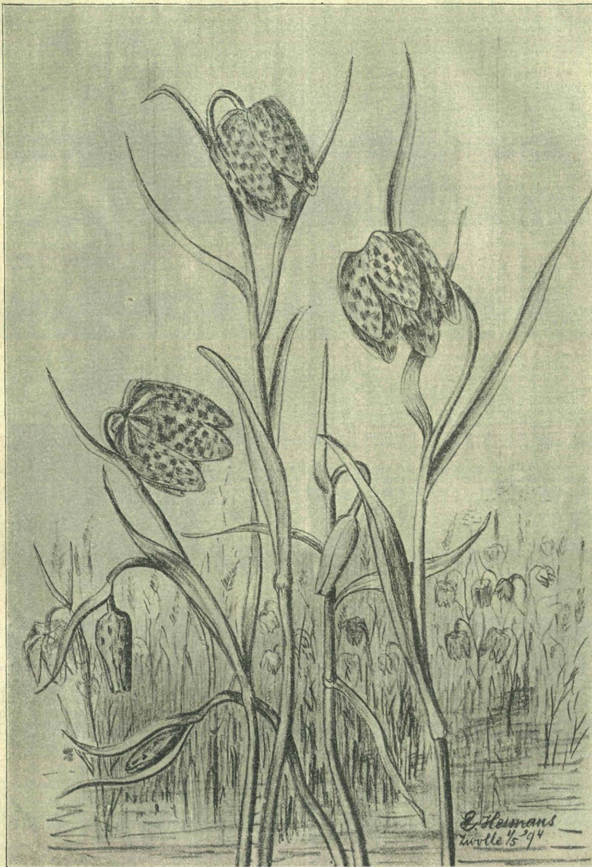
Kievitsbloem. ( Fritillaria meleagris )

Op natuurlijke grootte; licht roodachtig grijs, met donker-lila vlekken.