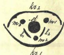
Diagram van een grasbloempje.

stamper heeft twee afzonderlijk geplaatste, zeer korte stijlen, die in lange pluimvormige stempels eindigen. Stamper en meeldraden zijn omgeven door eenige kaffes, waarvan er twee duidelijk te zien zijn. Die heeten (ten onrechte, maar dat kan ik niet helpen) de kroon-kaffes. Vier van die bloempjes (ook wel 3, 5, 6 of 7) vormen samen een aartje, dat aan zijn voet door twee stijve blaadjes omgeven wordt. Die twee stijve blaadjes worden kelkkaffes genoemd, ook ten onrechte, want 't is duidelijk dat een kelk niet aan 3—7 bloempjes behooren kan. Maar de