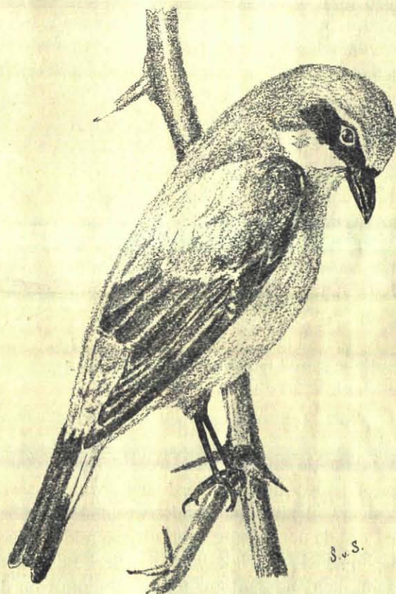
Grauwe Klauwier ♂ ( Lanius collurio L.) Naar een voorwerp in mijn verzameling.

Het is verbazend, wat zoo'n klauwier eten kan. Ik heb eens een wijfje waargenomen, dat een zeer groot insect had gevangen, meer dan half zoo groot als haar kop, en dat moest nu naar binnen. Ik dacht niet dat 't lukken zou, maar het ging opperbest. Na eenige krachtige spiersamentrekkingen verdween het insect in de keel, die geweldig opzwol en dadelijk weer slonk toen het hapje gepasseerd was. Een oogenblik bleef de vogel daarna doodstil zitten als om te rusten van de buitengewone inspanning, toen draaide hij een paar maal met zijn staart