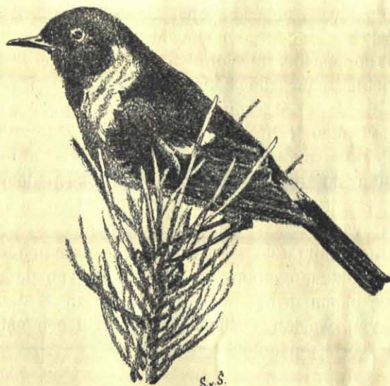
Roodborsttapuit. De oude heer van Augustus.