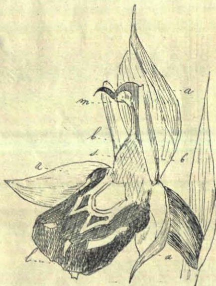
Een bloem van Ophrys apifera , a. de buitenste bloemdekblaadjes. b. twee van de binnenste bloemdekblaadjes. l. de lip. m. de meeldraad. s. de stempel.

Een viertal bloempjes slechts aan den stengel: het groote aantal zou de sierlijkheid van den enkeling verduisteren. De buitenste bloemdekblaadjes van het doorschijnendste rozerood, de naar beneden hangende lip van het zachtste fluweel met gele draden doorweven. „Ik meende eerst, dat er een bij op zat,” zei de jongen, die het plantje het eerst vond, en werkelijk bootst de lip vrij nauwkeurig zoo'n insect na.