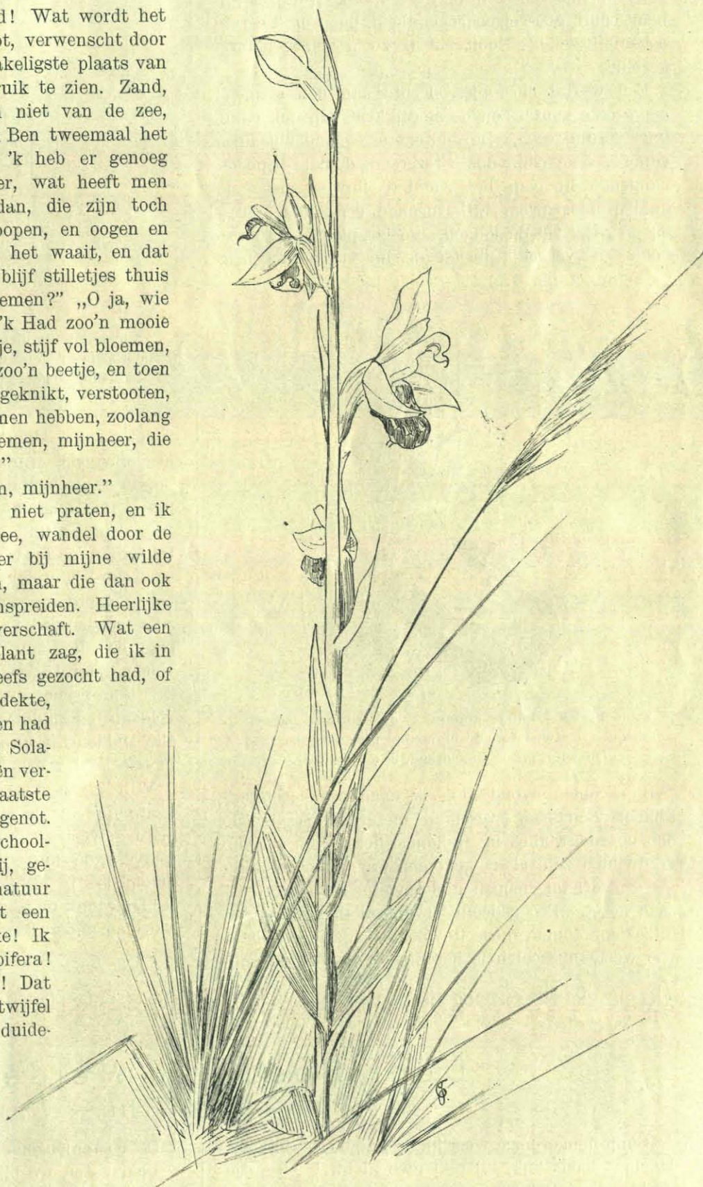
De Bijen-Orchis. Ophrys apifera .

Op een avond kwam een der schooljongens, een der velen, die Gij, geachte redactie, liefde voor de natuur ingeboezemd hebt, bij me met een bloem, een Orchidee, maar welke! Ik aan 't determineeren. Ophrys apifera ! Misschien in Limburg gevonden! Dat deed wel een weinig mijn twijfel bovenkomen, maar 't was toch duidelijk genoeg. De volgende dag zag mij al weer in de duinen zwerven om zelf de plantjes te zoeken. En ja, daar, in een der pannen, niet al te vochtig en niet al te droog, dicht bij een miniatuurbeekje, verhieven ze, zedig verscholen