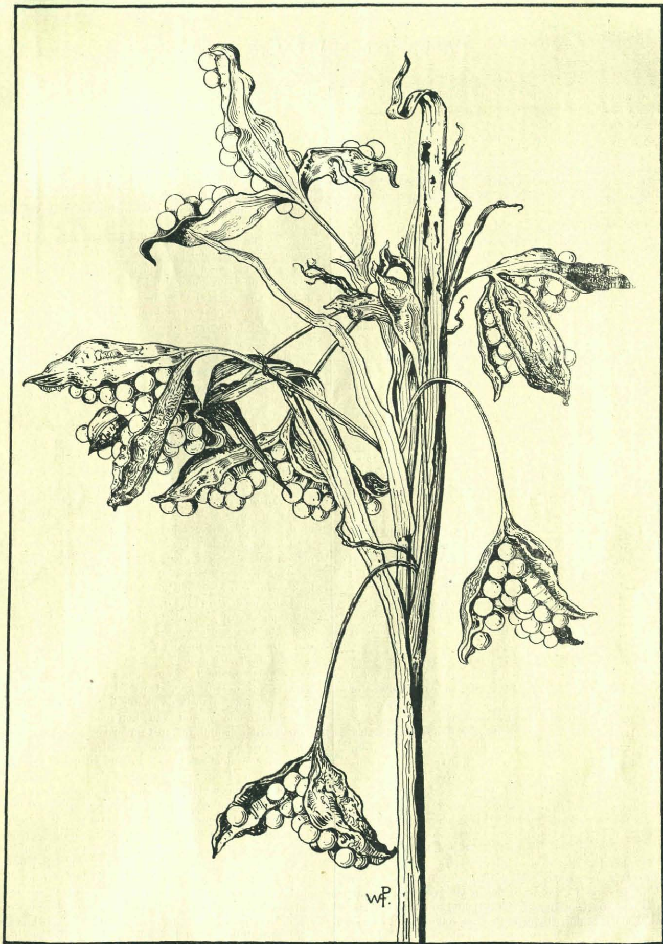
Vrucht-tak van Iris foetidissima . (Teekening van W. F. A. POTHAST).