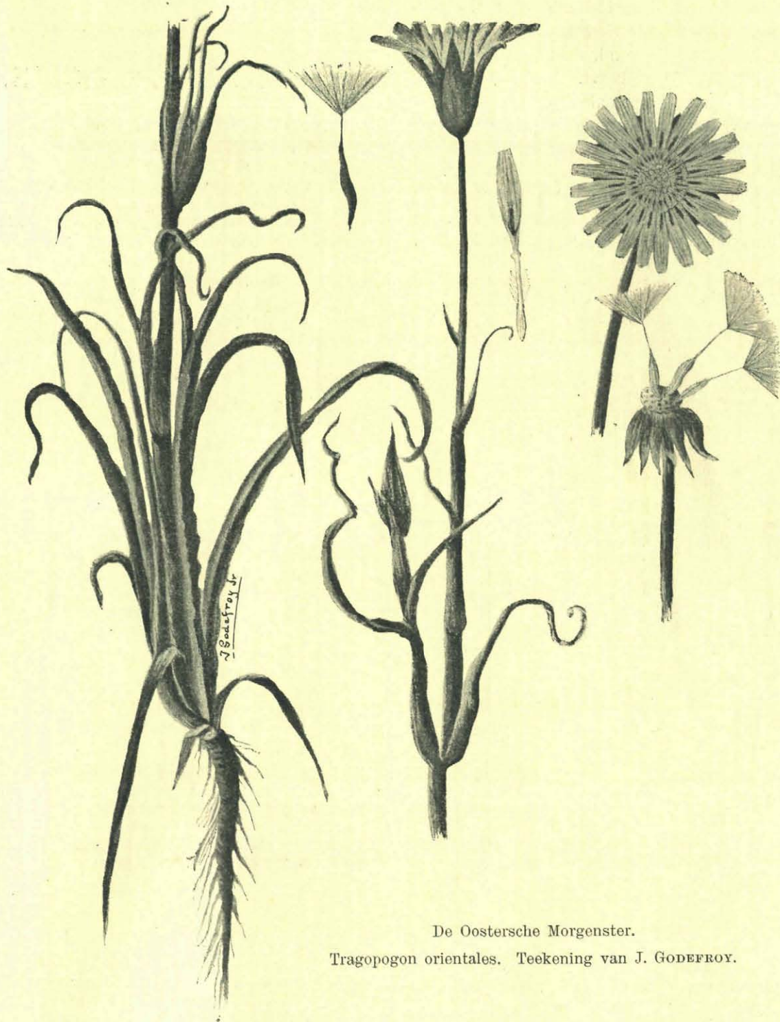
De Oostersche Morgenster.

Tragopogon orientales. Teekening van J. GODEFROY.