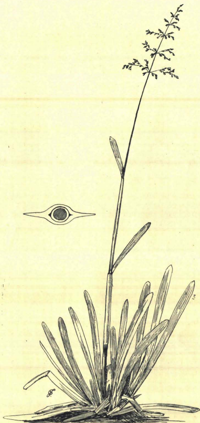
Berg-Beemdgras. Poa sudetica . Links: doorsnede van de halm met bladscheede.

ontdekker er bij gehaald, zooals ik hem ook het terrein in Diepenveen had geweest.