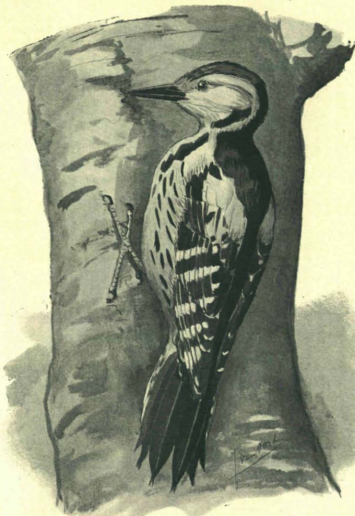
Middelste Bonte Specht. Teekening van Jan van Oort.