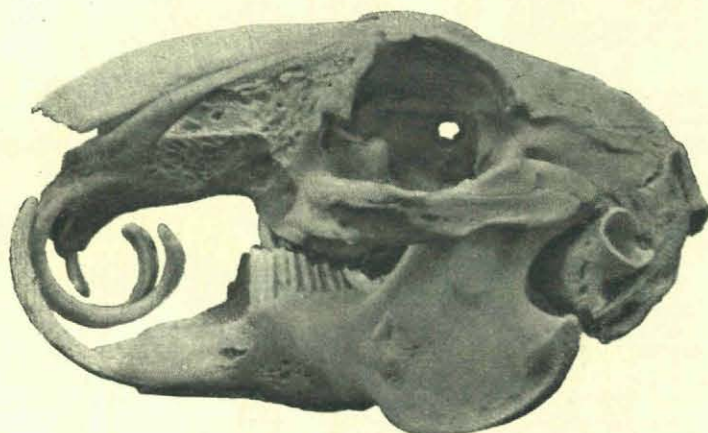
Hazekop met olifantstanden.

De eerste photo is zooals u ziet, die van een hazenkop