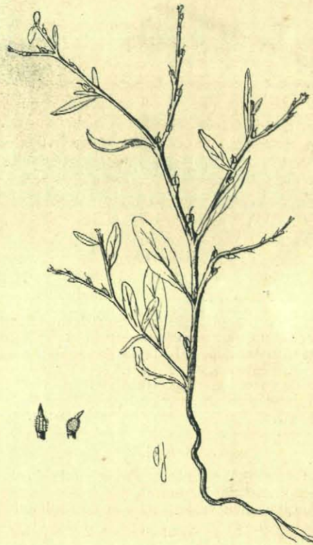
Euclidium syriacum .

Zoo vonden wij dit jaar vóór Juni Arabis arenosa , Ery-