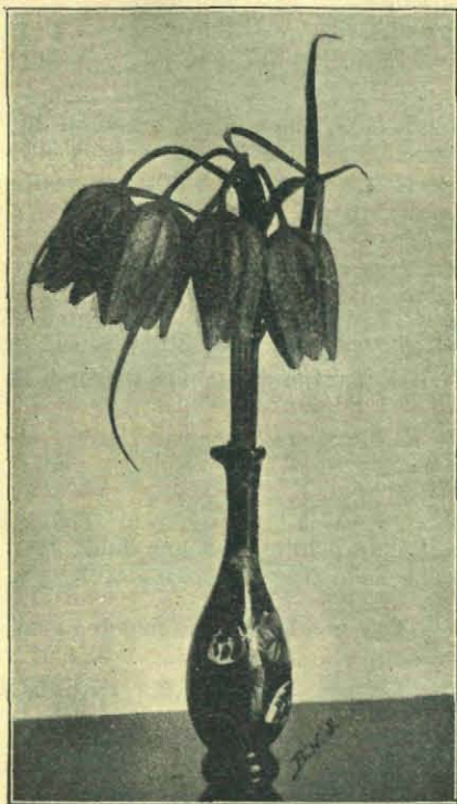
Bandvorming bij de Kievitsbloem.

Van eene goede kennis uit Oegstgeest ontving ik onlangs zeven Fritillaria 's. Merkwaardig was 't, dat alle fasciatie vertoonden. Zes er van, drie roode en drie witte, hadden een stengel, die uit 2 andere was samengegroeid, en droegen 2 bloemen. Maar No. 7 had niet minder dan vier bloemen en