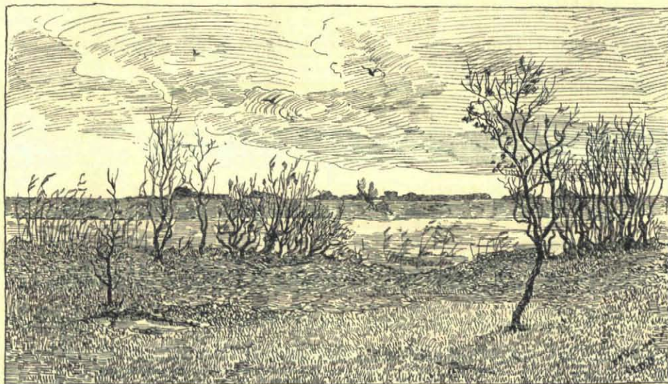
Egelheim aan den Poel. Teekening van C. L. DAKE Jr.

Nu daar had het dier volkomen gelijk in. Hij kon ook niet weten, dat ik alleen zijn grappig snuitje met de mooie zwarte oogjes eens wou zien, en op zijn hoogst zoo onbescheiden zou geweest zijn, voor 't geval heer egel weg ging draven, hem eens te volgen, om uit te vorschien, waar hij, dien