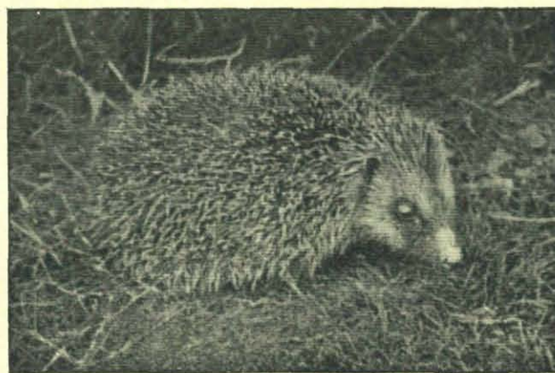
Na het ontrollen.

Daar had ik dan ook in 't geheel geen plan meer op. Ja, als in een egelhart eenig gevoel kan bestaan, een gevoel van blijdschap na 't gelukkig en wonderlijk