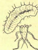
De jonge larve bij de „leege" bladluis.

Zoodra het Junizonnetje me den volgenden morgen wekte, ging ik mijne nieuwe vrienden weer eens opzoeken. Blijkbaar hadden ze maar net gedaan, of ze thuis waren. Van de stellig meer dan 150 bladluizen waren nog slechts de