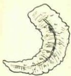
Omtastend naar buit.

De grootere larven konden er heel wat sneller mee over weg. Ik had bij de opgezamelde bijna volwassen sinjeurs van 1½ cM. lang. Dat waren werkelijk, ook reeds met het ongewapend oog bezien, mooie vlugge diertjes. De vorm is spanrupsachtig, van voren spits. De hoofdkleur is lichtbruin, „beige” zou men in de modewereld zeggen, en 't lichaam is met rijen puntjes bezet. Ze verplaatsen zich ook eenigszins op de bekende manier der landmeters. Ze rekken hun lichaam uit, bijten zich met den kop vast en sleepen daarna het achterlijf naar voren. Op eene eigenaardige, zenuw-