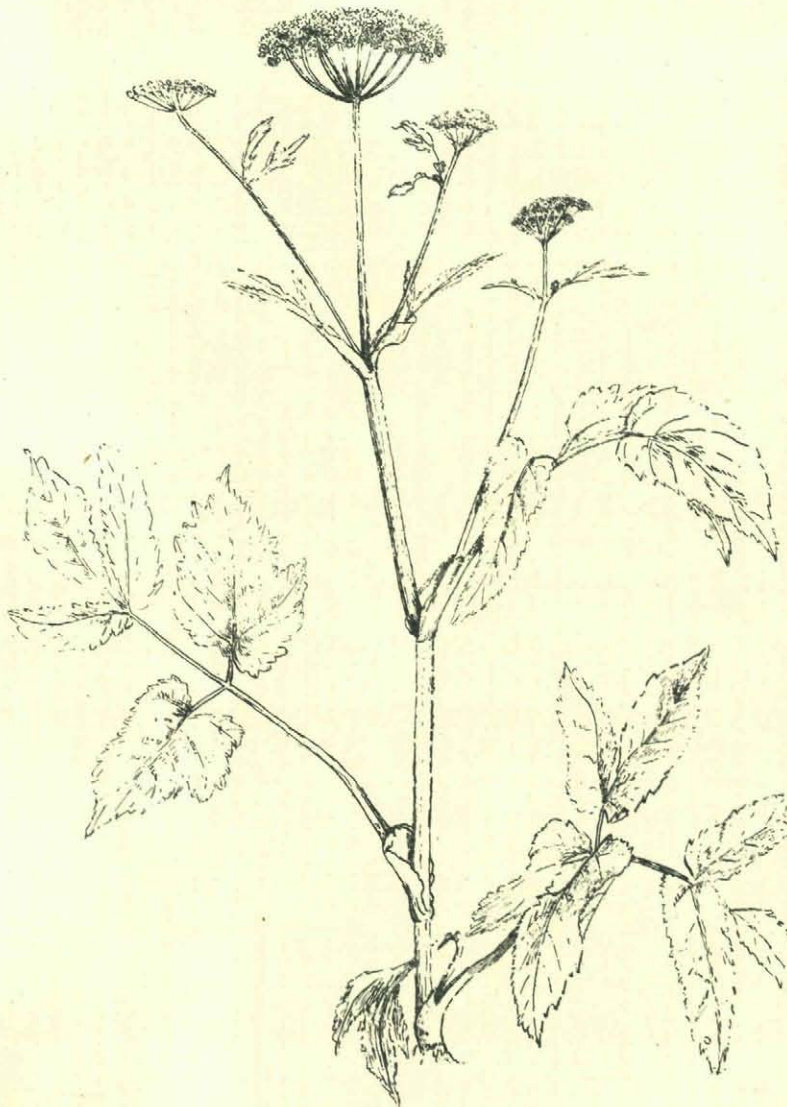
Zevenblad: Bloeiende Stengeltop.