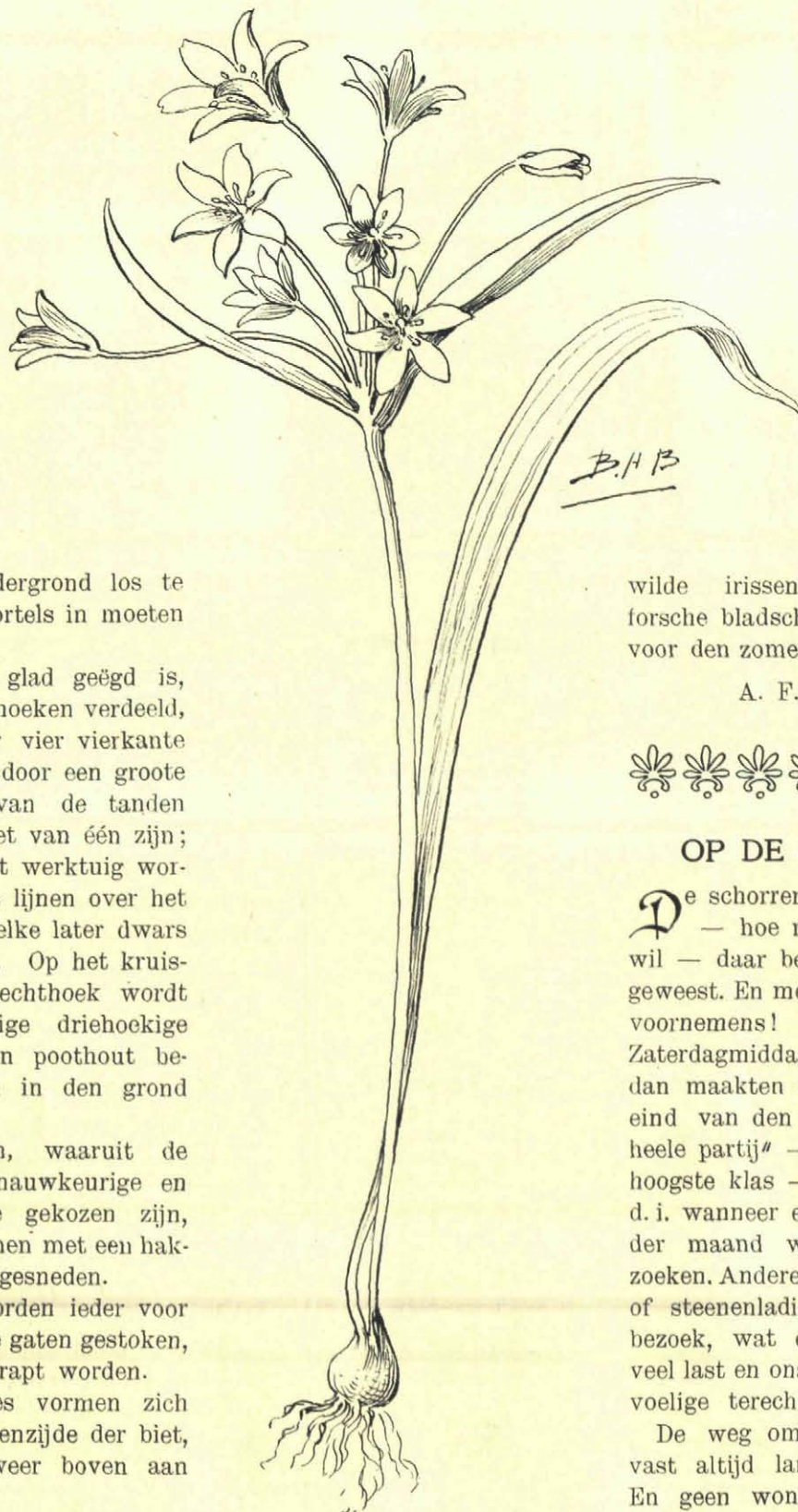
Bosch-Geelster. (Zie pag. 224.)

Koud en guur is het hier in den wind, maar