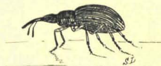
Apion. 2 mM. (Donkerblauw.)

Kalm klotst 't geelgroene water tegen de dijken van de verwerde, veelkleurige steenblokken, die op sommige plaatsen geheel met korstmossen begroeid zijn. Wenden