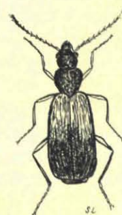
Dromius. 4 à 5 mM. (Br.-geel.)

Kalm klotst 't geelgroene water tegen de dijken van de verwerde, veelkleurige steenblokken, die op sommige plaatsen geheel met korstmossen begroeid zijn. Wenden