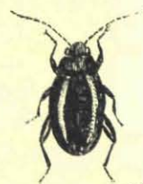
Phyllotreta. 3 mM.