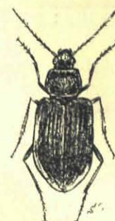
Platynus marginatus. 7 mM. (Blinkend groen, geel gerand.)