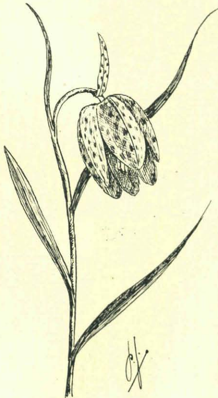
Kievitsbloem met gevlekt stengelblad

Bij duizenden hangen ze dan te bengelen, witte en roode! Merkwaardig is het groot aantal twee-bloemige exemplaren, dat daar te vinden is. Met een beetje geluk merkt men misschien wel een driebloemig exemplaar op; ja er bestaat zelfs eene, hoewel geringe, kans op een vierbloemige exemplaar (vgl. de fraaie foto in Jaargang VI, pag 147).