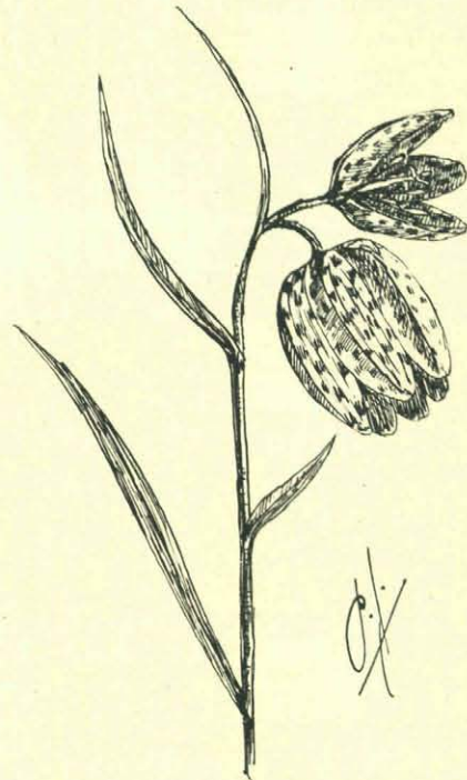
Kievitsbloem met één onontwikkelde bloem.

Grooter nog dan het aantal vormen is de verscheidenheid in kleur dezer bloemen. Men heeft ze gevonden — hoewel niet alle in ons land — van een zuiver witte, lichtgrijze,