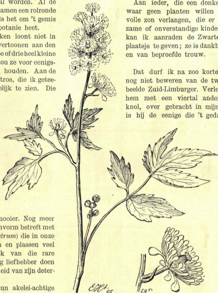
Giftige Zwarte Boschbes. Bloem, ruim dubbele grootte.