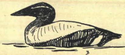
EIDERWAARD IN OVERGANGSKLEED.

Met de Pinksteren maakte ik een excursie naar Vlie en zag er 18 Mei op de Waddenzee 5 paren van deze eenden en 2 overcomplete waarden, die tijdens hoog water een paar honderd meter uit den wal lagen.